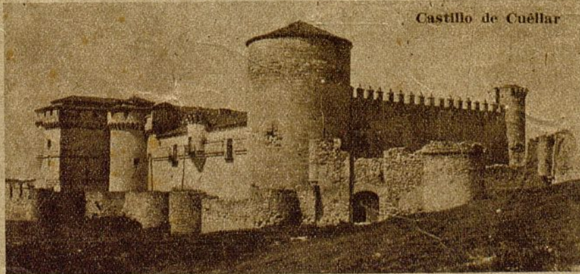
Castillo de Cuéllar

JOSE RICO DE ESTASEN (Información gráfica del autor.)