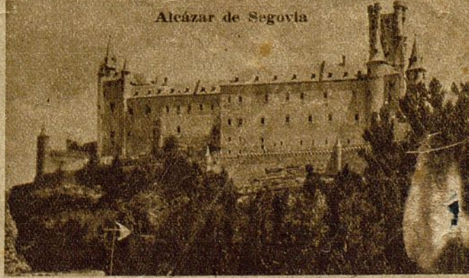
Alcázar de Segovia