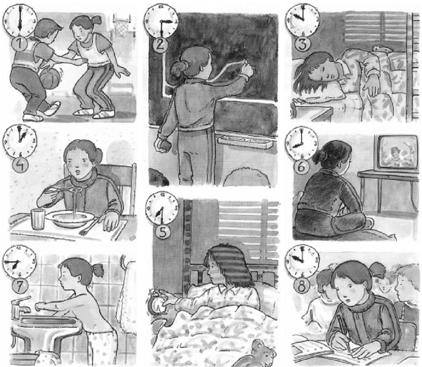
Figura 2. Dibuixos desordenats de l'organització de l'horari d'una nena de 8 anys.

Per treballar la periodització històrica al cicle superior de l'educació primària proposem un mural on apareixen