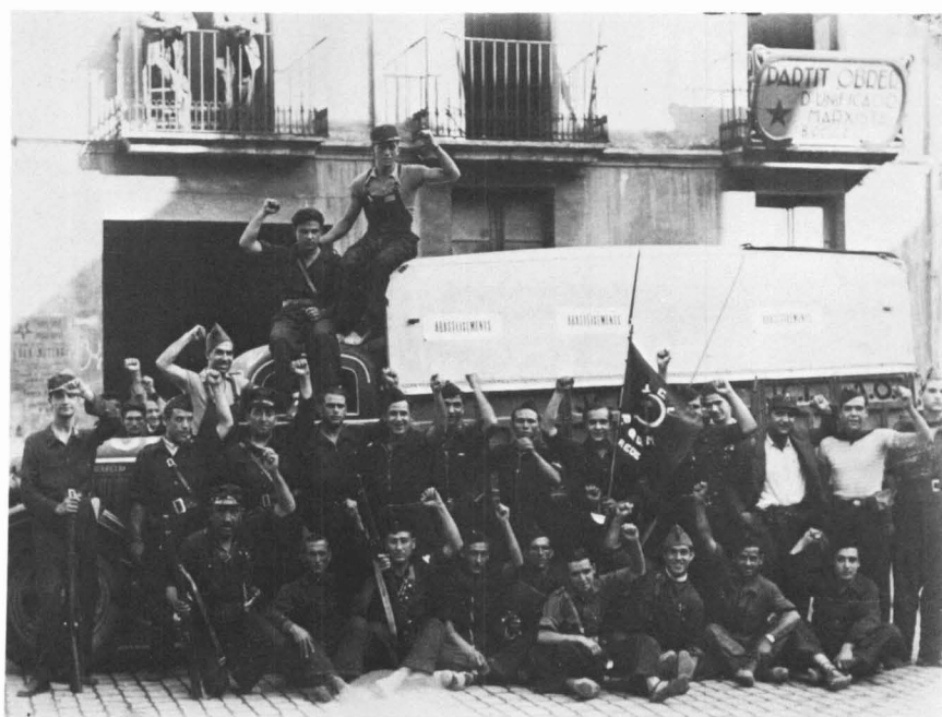
Dues vistes dels components de la columna «Reus-Saragossa», integrada per militants del POUM, que sortí de Reus cap al front d'Aragó el 18 d'agost del 1936. A la foto superior davant el local del partit a la plaça de Prim, en la incautada casa Vilanova. La inferior està feta davant del Fossar Vell.