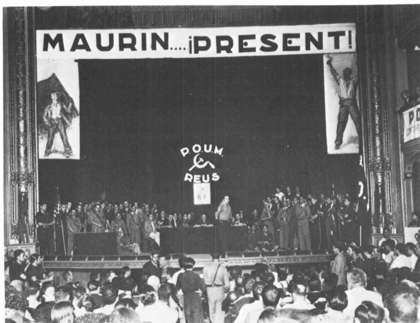
Miting del POUM, possiblement el del 10 de gener del 1937, al teatre Fortuny.