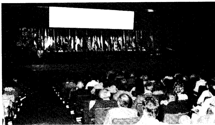
Sesión inaugural de la Conferencia Regional de la Unión Geográfica Internacional.