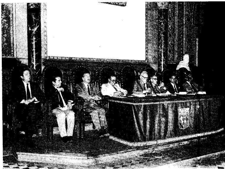
Sesión inaugural del III Congreso Ibérico de Geografía.