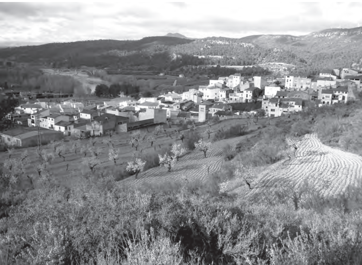
Fig. 5. Aspecte del nucli de Garcia, vist des del camí del coll del Maset.

Raduà dedica el darrer bloc del seu treball a l'estudi de la població, que aborda des d'un plantejament morfològic i demogràfic, tot facilitant un recompte de població per grups d'edat, que xifra en més d'un miler i mig d'habitants (enfrent dels 580 censats l'any 2011) i para especial atenció a la població envellida, en unes notes que avui dia resulten prou curioses: