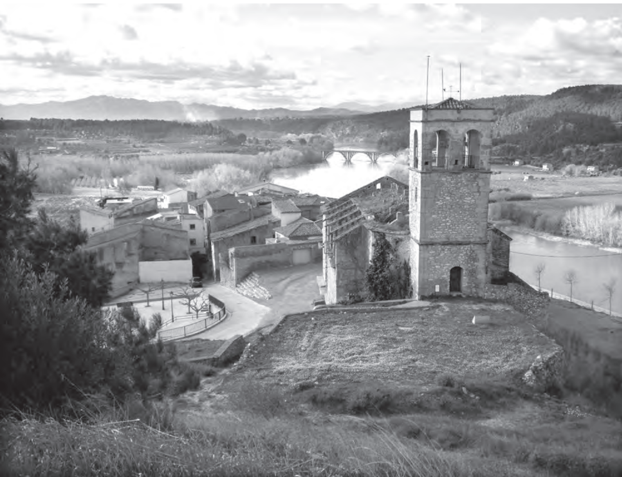
Fig. 2. Un aspecte de dues fixacions de Raduà: el riu Ebre i el pont del ferrocarril al seu pas per Garcia; en aquest cas, fotografiats des del turó del Castell; en primer terme, l'església vella.

cap baix, forçades. L'autor glossa les feines més habituals, com ara l'adob de la terra, i finalitza la seva breu exposició agronòmica amb un interessant comentari, que tant podria aplicar-se antany com enguany: