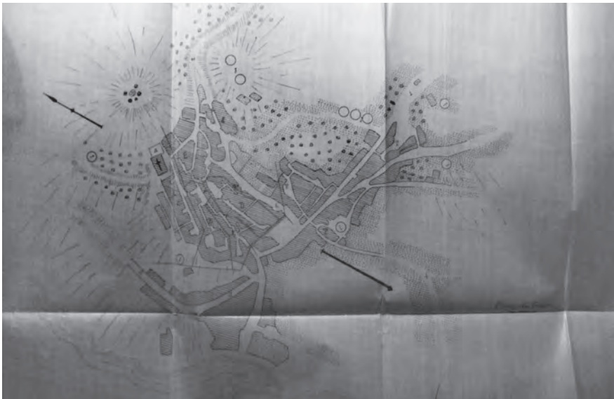
Fig. 4. Plànol urbà de Garcia. Hi és fàcilment distingible el teixit urbà i els vials. El relleu es troba representat per normals i l'ocupació del sòl per trames. Resulta ben visible la ubicació de l'església (actual església vella), el riu Ebre i el pas de la barca. Noteu-hi la falta d'escala i l'orientació cap al nord-oest.