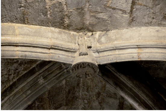
Figura 2. Clave de bóveda de Sant Jaume de Rocamora, por Xènia Granero Villa (2016).

observarse en una miniatura del manuscrito de la Gesta del Graal , conservado en la Biblioteca Nacional de Francia (343, f. 7) (Ugalde, 2007: 46). En el caso de Tarragona, puede añadirse otra función, que todavía hoy puede verse durante las ceremonias más solemnes 4 : la clave horadada del cimborrio sirve para colgar el badajo de la campana que hay en el exterior del edificio y que se hace sonar en determinados momentos de estas misas.