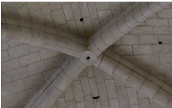
Figura 3. Clave de bóveda de la catedral de Tarragona, por Xènia Granero Villa (2016).