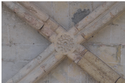
Figura 1. Clave de bóveda del claustro de la catedral de Tarragona, por Xènia Granero Villa (2016).

excepciones (García, 1681: 61-62). Debe añadirse que no todas las claves de bóveda tienen la misma función dentro de la estructura, pues existen dos tipos: las sustentantes, que son la polar o principal y las de terceletes, y las sustentadas, como las de ligaduras y combados, que se encuentran en mitad de los nervios y tienen una función decorativa.