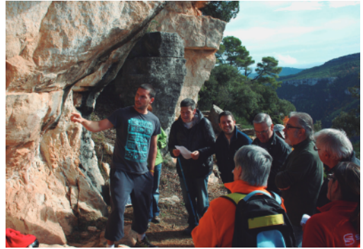
Curs de formació per a guies.

Am amb el finançament del Ministerio de Educación, Cultura y Deporte i el suport de l'Ajuntament de Montblanc, es va dur a terme la millora de la pista forestal de Montblanc a Rojals (pista del camí Les Aigües) per a l'accés de vehicles tot terreny, i també es varen condicionar els camins per als visitants. Per altra part, s'executaren di-