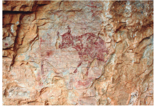
Escena principal del Mas d'en Ramon d'en Besó