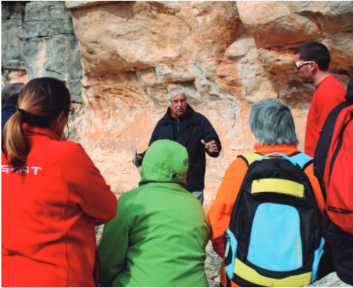
Visitants als abrics

reduïdes i oscil·len entre els 6 i 10 m de llargada, 2 i 3 m de fondària, i 2 i 7 m d'alçada. Els panells pintats responen a dogues tradicions culturals ben diferenciades: per una part, la caçadora-recol·lectora (Art Llevantí), i per altra, la tradició pagesa-ramadera (Art Esquemàtic).