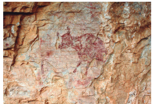
Pintures esquemàtiques i abstractes del Portell de les Lletres