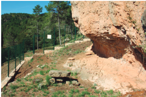
Condicionaments dels abrics del barranc del Mas d'en Llorc