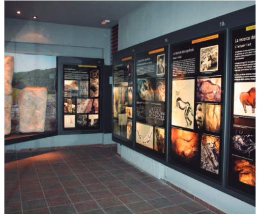
Vista de les reproduccions dels conjunts rupestres CIAR

Com la resta dels Centres d'Interpretació de l'Art Rupestre, el de Montblanc (situat a la planta baixa de l'edifici de la nova presó), va ser construït com una secció monogràfica del Museu Comarcal de la Conca de Barberà, per tal d'impulsar el coneixement, la divulgació i preservació del nucli rupestre i el seu entorn: les Muntanyes de Prades (Solé i Viñas, 2005; Viñas i Solé, 2005).