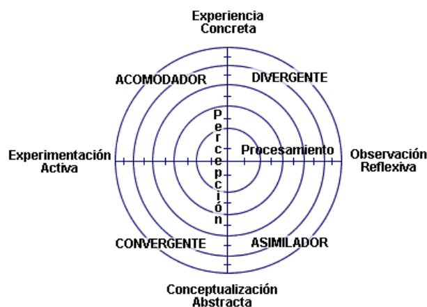
Figura 2 (Estilos de Aprendizaje, Kolb, 1984)

Peter Honey y Alan Mumford (1986), en base a la teoría de Kolb, desarrollan, una vuelta de tuerca al modelo, creando cuatro estilos de aprendizaje. La publicación de sus trabajos recogidos en el libro de test y pruebas evaluativas “ Learning styles questionnaire: 80-item version. (2006) ”, constituye un hito en explicar la forma en que aprendemos las personas, en función de nuestra percepción y estilo de personalidad, a través de un test, adaptado a decenas de culturas y nacionalidades. Así, cada persona desarrolla un estilo de aprendizaje propio basado en sus propias experiencias y percepciones, con lo que se establece cuatro tipos o estilos de aprendizaje: