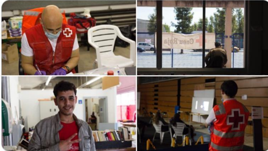
Creu Roja Catalunya i Cruz Roja Española

Aquesta setmana hem inserit 2 usuaris més de l'Alberg del Serrallo al món laboral, s'incorporen a treballar a un centre logístic. Des que es va posar en funcionament l'alberg gestionat per @CreuRojaTGN, 6 persones sense llar han trobat feina #CreuRojaRespon @TGNAjuntament