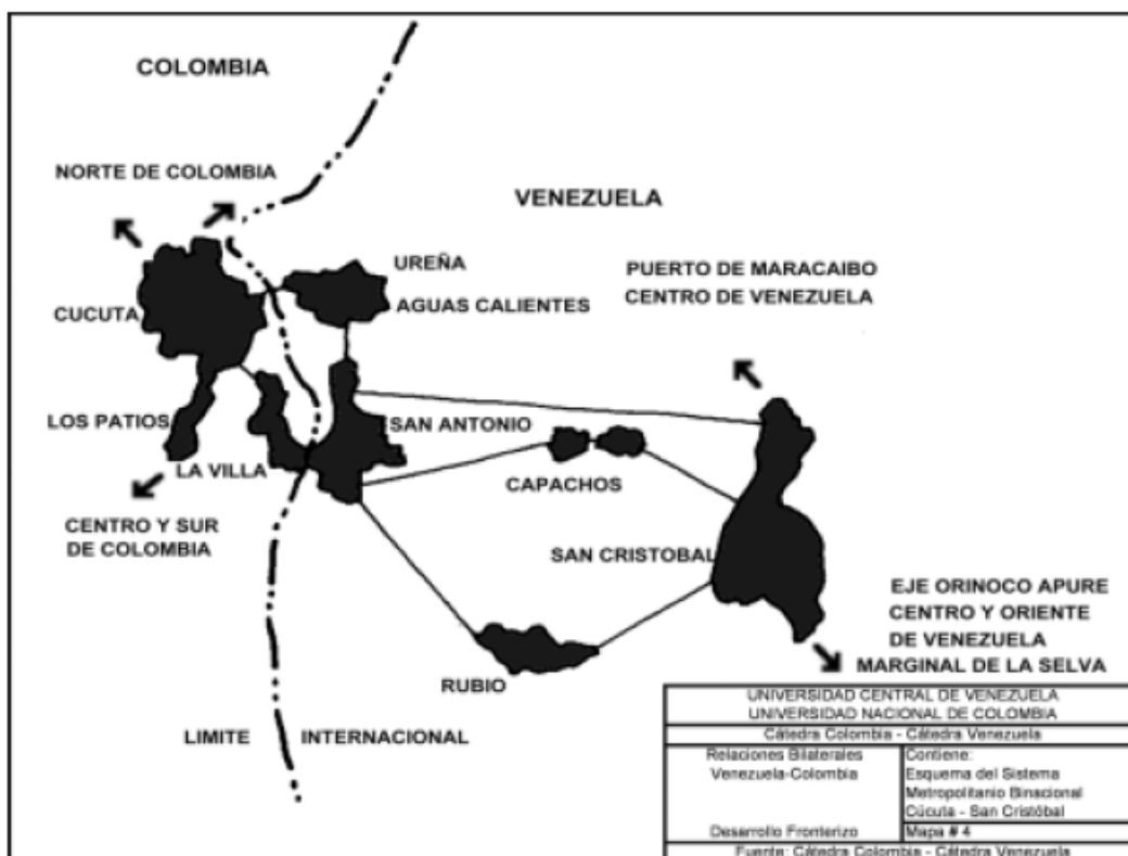
Mapa N°4.3 Sistema Metropolitano binacional (Urdaneta, 1999: 54).