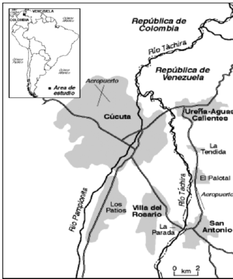
Mapa N°4.2 Espacio metropolitano binacional de Colombia y Venezuela (Gómez y Linares, 2004)

Durante un largo periodo de la historia, este espacio constituyó una sola unidad durante el dominio del imperio colonial español y continuó después de la separación de la Gran Colombia. “Esta vocación integracionista se entrelaza con una historia y geografía compartidas en las que la existencia del río Táchira y su cuenca revive este pasado común”, dice la investigadora Raquel Álvarez (2000: 267). A causa de la accidentada topografía, la región mantuvo cierto aislamiento de los poderes centrales, tanto en la colonia como en la era republicana, hasta cuando en el primer cuarto del siglo veinte, se construyeron las vías que conectan a las capitales de sus respectivos países, Bogotá y Caracas.