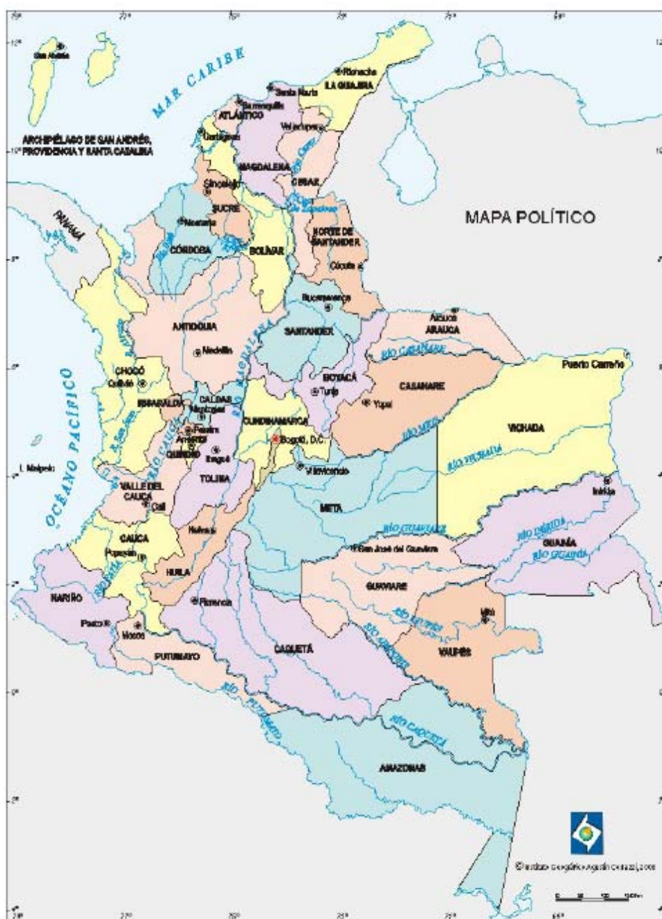
Mapa N°4.5 Mapa político de la República de Colombia