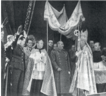
Acte religiós amb la presència, sota pal·li, del dictador Franco

Crec que estarem d'acord que el franquisme va ser una dictadura amb el seu dictador Francisco Franco al capdavant. Ho reconeix fins i tot la Real Academia de la Historia, això sí, només des de fa una setmana. Potser d'aquí a uns quants anys o unes quantes dècades, aquesta institució reconeixerà el dictador com el màxim responsable d'un règim que practicà el genocidi, amb uns objectius, una organització i una planificació, perfectament qualificables com a tals. Molts historiadors ja ho han definit així.