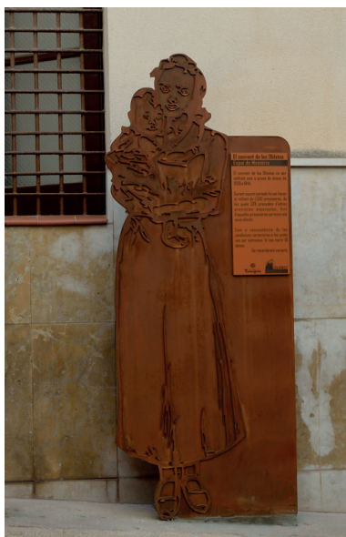
Monument d'homenatge a les dones que van ser empresonades al convent de les Oblates a Tarragona 1939-1942. Instal·lat a la porta del convent, el 13-04-2014, per l'Associació de Victimes de la Repressió Franquista a Tarragona (AVRFT).

Durant aquest període de temps, la jerarquia de l'Església no va aixecar la seva veu oficial en contra de totes les infinites ignomínies del règim. Serà molt difícil una reconciliació efectiva, sense l'assumpció d'aquestes responsabilitats i sense aquesta petició de perdó.