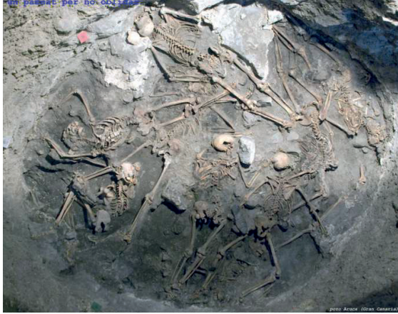
Fossa comuna. Un dels tres pous del Llano de las Brujas. ARAUCAS. (Gran Canaria).

guerra i de la repressió, en cunetes, camins, boscos i cementiris. Concretament a Catalunya hi ha 343 fosses comptabilitzades i a la resta de l'Estat, 2.052. La immensa majoria d'aquestes fosses no tenen cap senyalització, ni dignificació, ni han pogut recuperar-se les despulles que amaguen. Tampoc no han rebut cap element d'identificació ni d'homenatge les persones que hi ha inhumades.