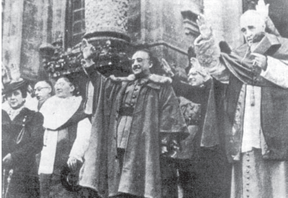
El dictador Franco i dirigents de l'Església catòlica fent la salutació feixista a la sortida d'un ofici.

completament, menyspreades, no ateses en les seves reivindicacions ni en les seves demandes d'ajut i reconeixement. Però tot i així, han demostrat que no busquen revenja sinó veritat, justícia i reparació. Fins i tot, en la seva legítima petició de justícia, han hagut d'invocar el principi de justícia universal i demanar ajut als tribunals de justícia de l'Argentina perquè siguin escoltats i acceptats, en seu judicial, tant el seu testimoniatge com les seves peticions de justícia.