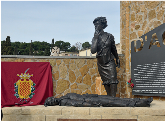
Grup Escultòric DIGNITAT. Monument d'homenatge a les víctimes de la repressió franquista a Tarragona ubicat, el desembre de 2010, a la fossa comuna del cementiri de la ciutat i promogut per l'Associació de víctimes de la repressió franquista a Tarragona (AVRFT)

Per acabar, hem de considerar que també durant el període democràtic, les víctimes de la repressió franquista i els seus familiars, ens hem sentit oblidats per les institucions i per la societat en general. Durant molts anys no s'ha volgut parlar de la repressió que es va produir en la dictadura franquista ni de la complicitat de l'Església catòlica, en especial de la seva jerarquia. Així, durant tots aquests anys de democràcia, l'Església no ha volgut reconèixer de forma oberta, la seva participació necessària en la consolidació i manteniment del règim franquista, fet pel qual, encara no ha demanat perdó d'una manera clara, extensa i contundent.