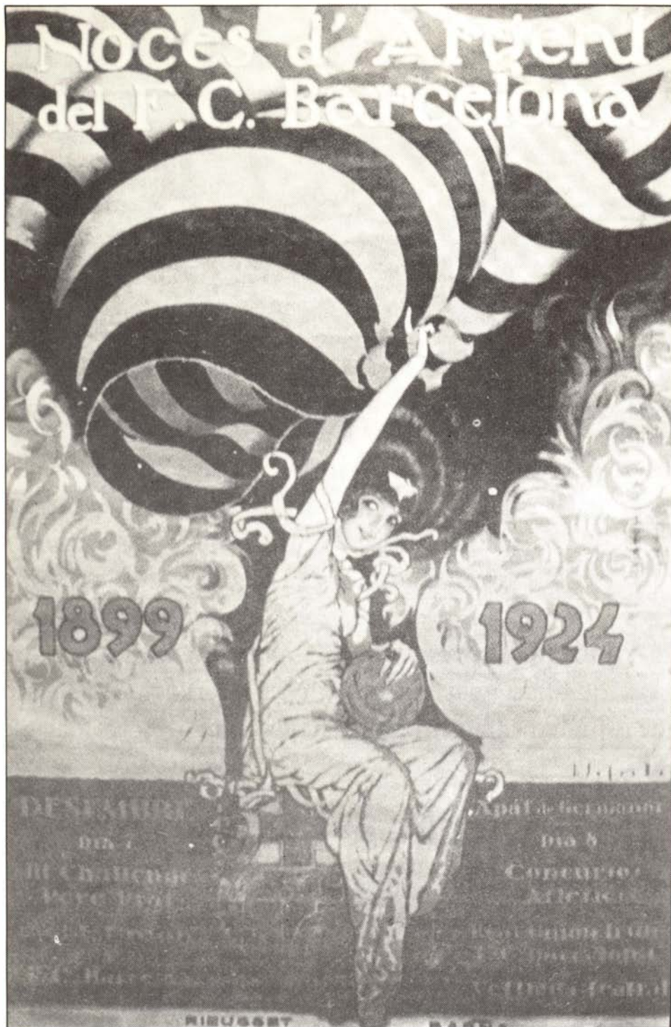
Cartell de Segrelles per a les noces d'argent del F.C. Barcelona. El Barça ja era alesbores "més que un club".