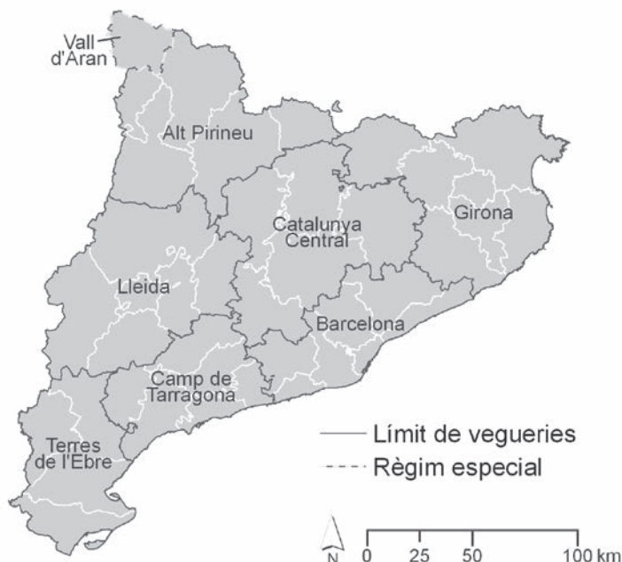
Figura 1. L'organització territorial en vegueries del 3/8/2010

Autor: Laboratori de Cartografia i SIG, Departament de Geografia, Universitat Rovira i Virgili