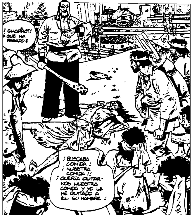
Còmic d'A. Font. Los protectores . «Totem» 5 (1977).

La identitat no s'entén sense l'alteritat, és a dir, que la nostra idiosincràsia s'explica per la nostra relació amb les persones del nostre voltant.