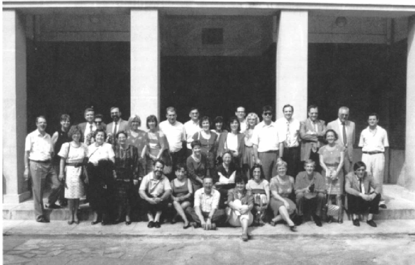
Primera promoció de mestres del pla del 1967, reunits a la port de l'antiga Escola Normal "Verge del Claustre", amb motiu de la celebració del 25è aniversari de l'acabament dels estudis