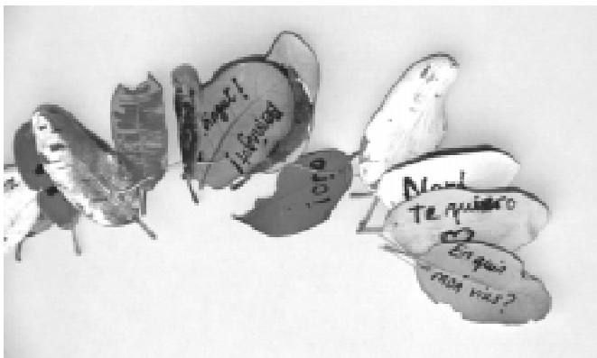
Figura 5. Omar Moreno

cici proposava canviar els llocs tradicionals d'exposició per altres espais (urbans o naturals) propers a l'alumnat on la interacció amb l'espectador fos directa. Els elements constituïts dels espais escollits van esdevenir alhora suports de creació artística.