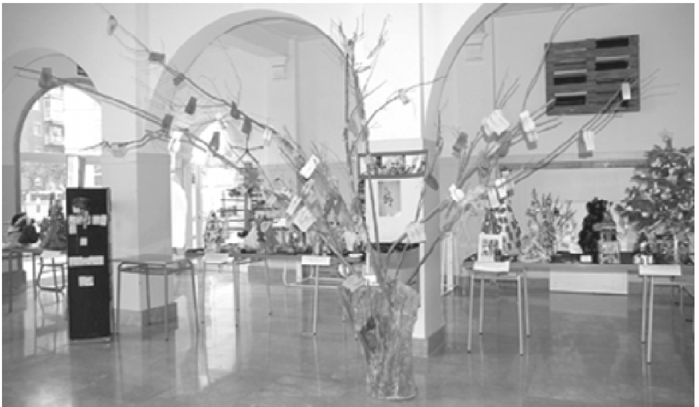
Figura 2. Ainara Garcia: Cupiditas Arboris (soca d'arbre, branques, els dissenys per a l'any nou dels companys i companyes escrits sobre cartolines de colors). Tema: L'esperança

Volem destacar a continuació alguns dels exercicis