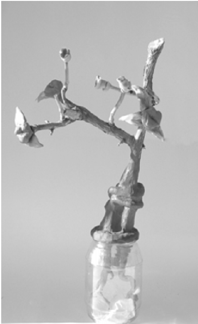
Figura 3. Maria Colom: Abrasarum vulgaris . "Arbre mua" (pot de vidre, plastilina, branquetes). Tema: La recerca de la felicitat.

"Cercada amb deliri, l' Abrasarum , més coneguda com la planta Mua, surt només per Nadal, i ha pogut ser gaudida per molt poca gent. Creix al fons dels armaris més humils, és impossible de ser cultivada, ja que s'alimenta mitjançant les seves gruixudes arrels blau cel, de la il·lusió i l'esperança que crea el Nadal. El tronc d'aquesta es caracteritza per formar unes ones al peu, que suggereixen dos cossos abraçats. Els fruits, seguint la mateixa línia, tenen forma de llavis. El seu sabor es diu que és el petó més dolç que s'hagi gaudit en el decurs d'una vida. La persona que posseeix la Mua i és capaç de compartir-la amb els seus éssers estimats, també serà capaç de tocar la felicitat, no pas pels girs del destí ni per cops de sort, simplement sabrà gaudir de les petites coses que els altres passen per alt contínuament, dia rera dia, de manera trista però inevitable. Si la planta es ven, els efectes es perden. D'aquesta manera, la seva cerca s'ha convertit en una tradició de cada Nadal, tothom aparca el materialisme i l'ambició per poder així ser la persona que es desitja tant ser. La Mua ens dona l'únic concepte pur i incapaç de ser transformat".