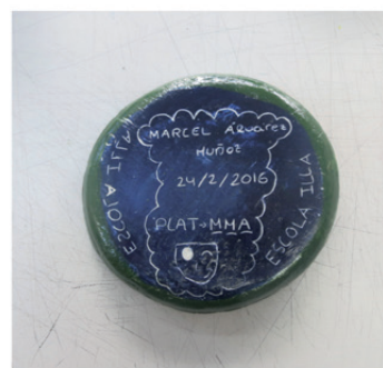
Plats dels adolescents dels pares