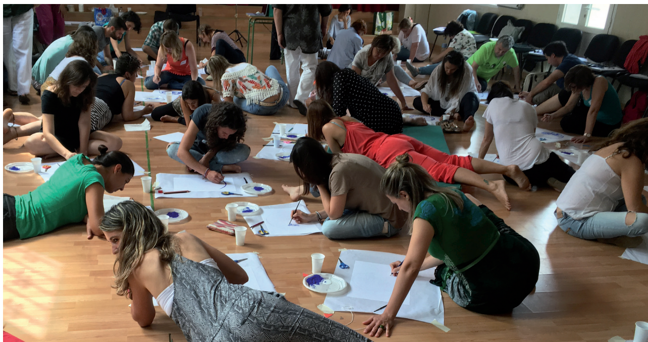
El silenci que es genera a l'aula quan fem una cosa que té a veure amb nosaltres

Seguint les nostres intencions sistèmiques i amb voluntat de fer de l'aula un espai de reconciliació