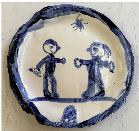
El pare deixa de ser Darth Vader per acostar-se a la mare

Aquests reculls del nostre alumnat ens recorden el que deien Viktor Frankl (1946) i posteriorment Boris Cyrulnik (2009): que les claus de la resiliència són dos fets, el vincle i els relats que ens fem.