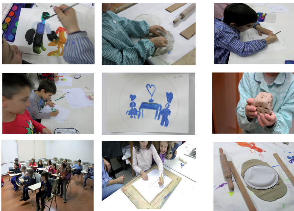
Plantejament i treball amb ceràmica

El dibuix d'un drac envoltant un ou va ser la representació d'un nen fruit d'una fecundació in vitro en una família monoparental: el drac protegeix l'essència que el pare absent va aportar perquè ell fos aquí.