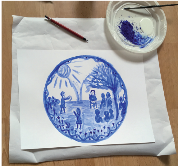
Plat amb pigment blauet i cola blanca