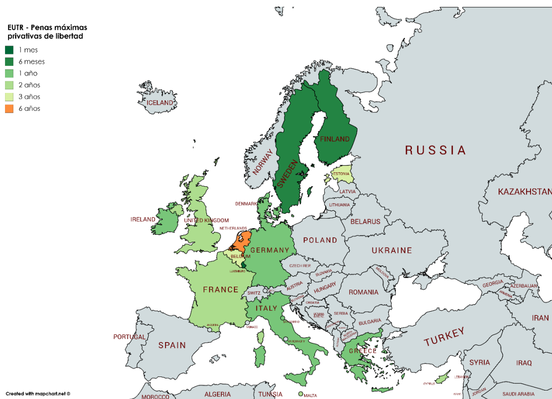
Figura 2 (elaboración propia): Penas máximas privativas de libertad previstas por los Estados miembros por infracción del EUTR.

Como puede observarse, las penas máximas privativas de libertad oscilan entre 1 mes (Luxemburgo) y 6 años (Países Bajos), situándose la mayoría de países en una horquilla que va de 1 a 3 años de prisión.