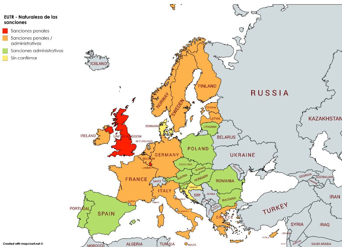
Figura 1 (elaboración propia): Naturaleza de las sanciones previstas por los Estados miembros por infracción del EUTR.

Como puede observarse, los Estados miembros han optado mayoritariamente, o bien por una combinación de sanciones penales y administrativas (14 países), o bien por sanciones administrativas (11 países), siendo minoritaria la opción por sanciones penales exclusivamente (2 países).