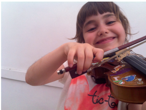
Figura 1. Aprenentatge del violí en edats primerenques

Es tracta d'una excel·lent metodologia per començar a adquirir una determinada base amb l'instrument. La tècnica s'aconsegueix molt progressivament i gràcies a un repertori de cançons senzilles.