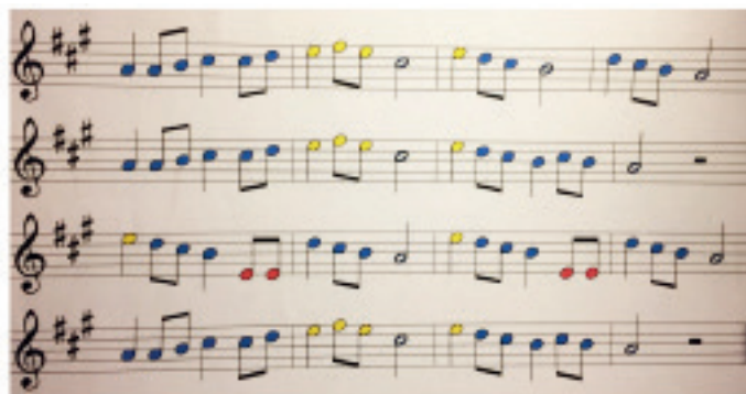
Figura 5. Adaptació d'una partitura de Suzuki amb els colors utilitzats pel mètode de Geza Szilvay

Utilitzant el recurs dels colors proposats en aquesta metodologia, s'hi poden adaptar les cançons del mètode Suzuki (vegeu la imatge 5).