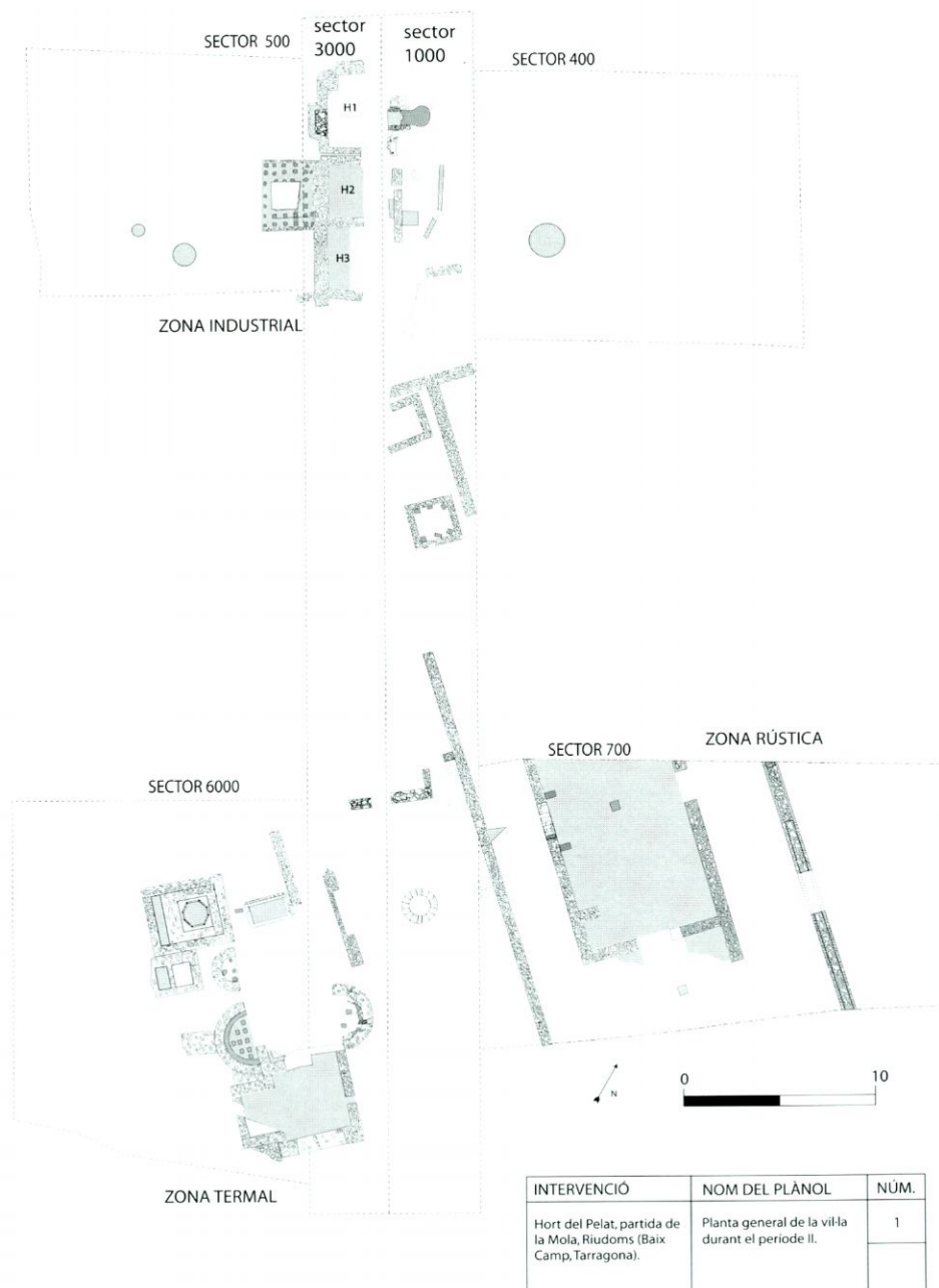
Fig. 1. - Planta general de la vil·la durant el període II.