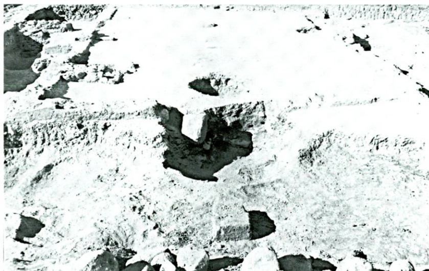
Fig. 5: Vista general del sector 700.