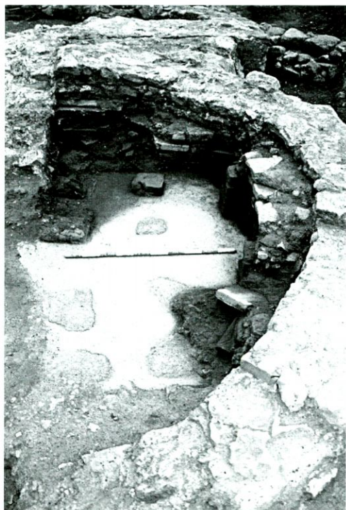
Fig. 4: Detall de l'absis de la zona termal