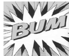
Ilustración 6: actividades presentadas a lo largo del desarrollo del tema (p. 34)