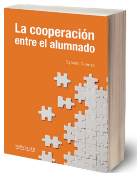
Figura 1. Coberta del llibre La cooperación entre el alumnado .