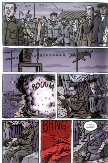
Imatge 1. Port d'Alacant.

Crua, impactant, absorbent i immersiva. Amb aquestes poques paraules descriuria aquesta gran obra. Los surcos del azar és una història il·lustrada (o còmic, com la majoria dels amants d'aquest gènere literari acostumem a dir) que transmet moltes sensacions mentre la vas llegint, des de l'angoixa i la tristor fins a la il·lusió i la motivació. Paco Roca té una manera d'escriure i d'il·lustrar molt realista i propera, aconsegueix una immersió al lector que sols un mestre d'aquest gènere literari sap aconseguir; els diàlegs i les expressions facials dels personatges en són la prova, per posar alguns exemples. Sense pretendre-ho, quan comences a llegir i observar les vinyetes, et quedes atrapat en aquesta història fins que l'acabes.