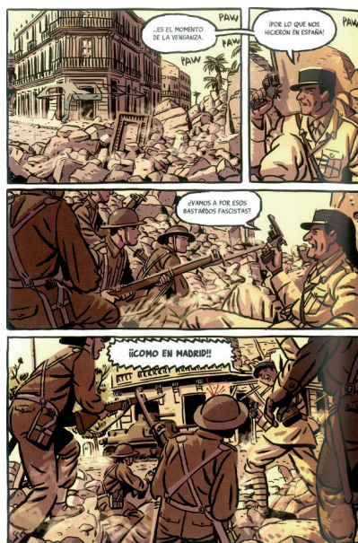
Imatge 4. Camp de batalla.