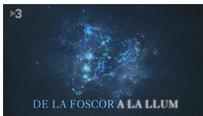
Captura de imagen (TV3, 9-7-2020).