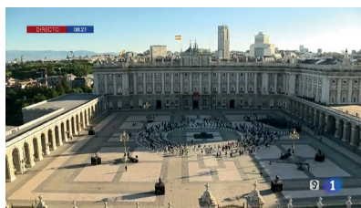
Captura de imagen (TV1, 16-7-2020).

A pesar de la modestia que, comparativamente, presentaba el acto institucional de duelo que organizó el ayuntamiento de Olesa de Montserrat el 19 de julio, esta se vio complementada con la colocación de tres grandes cubos en el parque adyacente a la sede consistorial, en cuyas paredes laterales se invitaba a la ciudadanía a dejar su testimonio escrito en relación con los difuntos del coronavirus. Esa instalación permaneció unos diez días antes de la celebración del acto, que fue restringido a los familiares que perdieron a un ser querido durante este período inicial de la pandemia ( fotos 5 y 6 ).