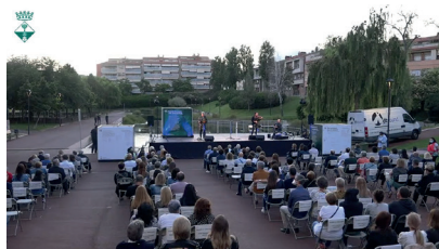
Olesa de Montserrat