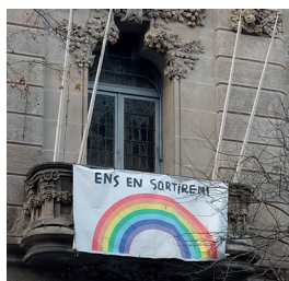
Pancarta en la sede del distrito de Sants-Montjuïc (Barcelona) (23-2-2022).