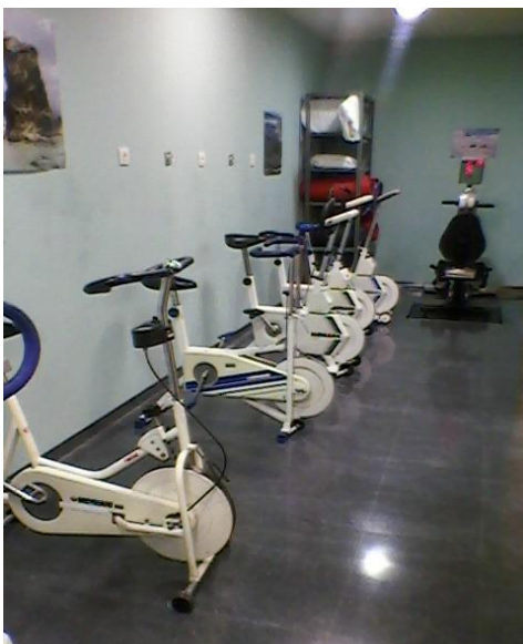
SALA DE FISIOTERAPIA