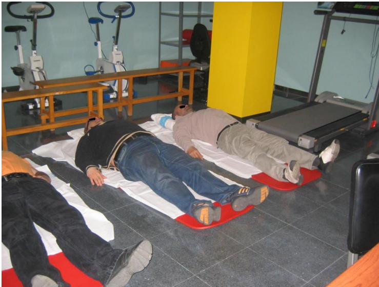
SESIÓN DE RELAJACIÓN