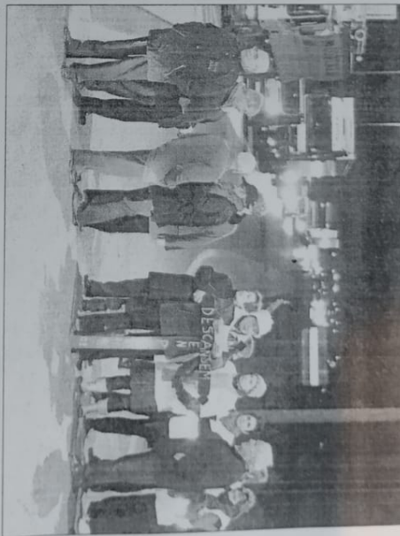
Els paguesos van tallar la carretera a Almenar divendres.

Fins a 400 estalviadors tenen bloquejats els seus fons per la suspensió de pagaments de la secció de crèdit de Copalme