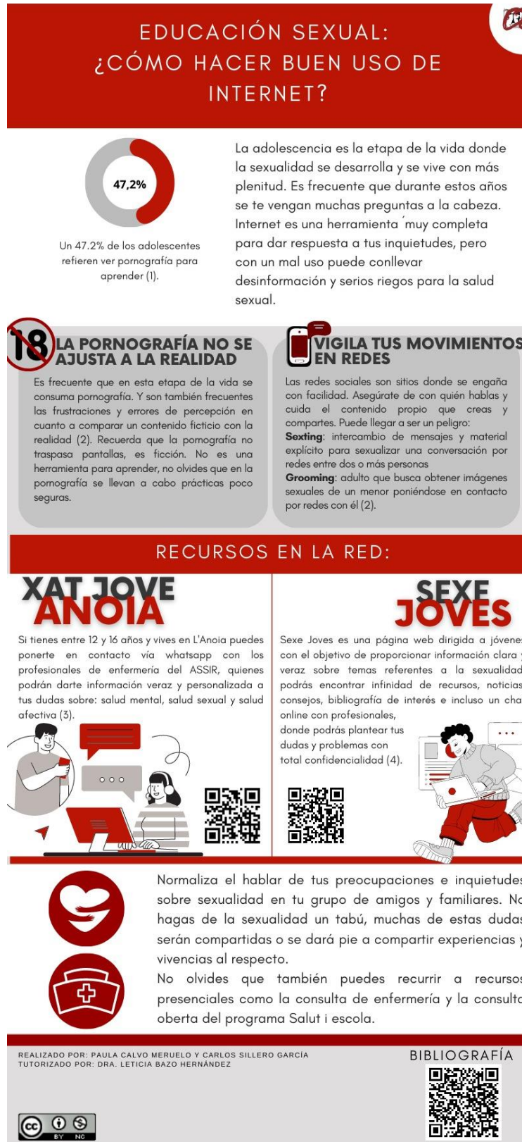
Ilustración 2: Infografía. Elaboración Ad.Hoc

Se expone la herramienta de difusión de contenido comentada en el apartado 4.6.