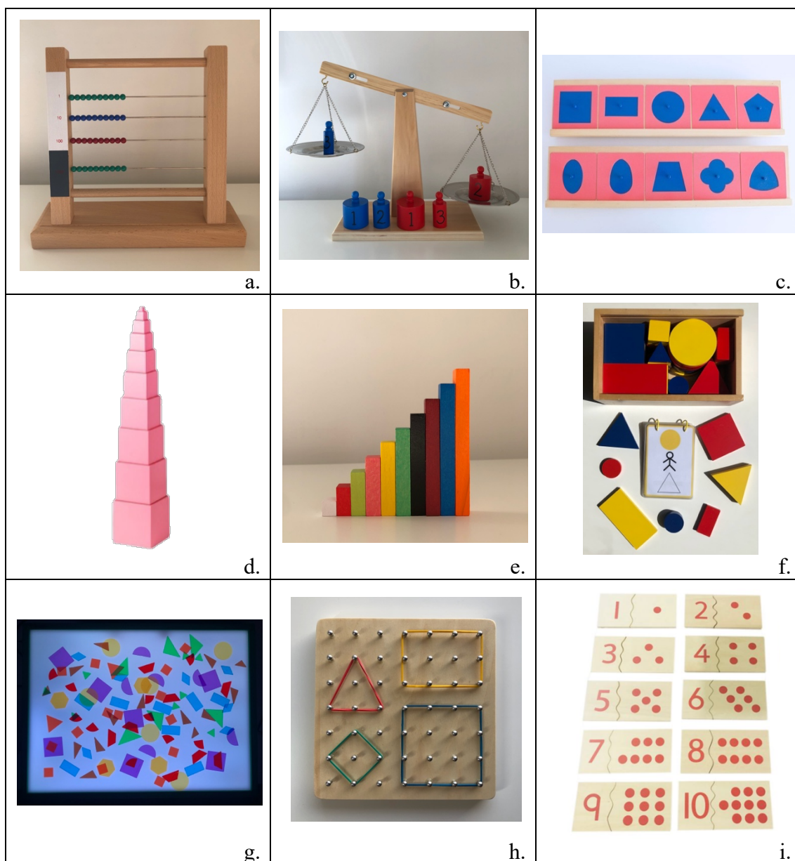
Figura 1. Materials didàctics proposats per experts

Nota. Totes les fotografies són d'elaboració pròpia excepte la figura 1.c., 1.d. i 1.i. Les tres figures estan extretes de www.mumuchu.com