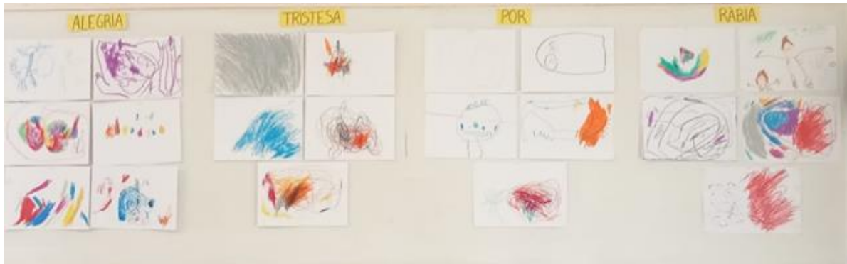
Figura 11. Mural de les emocions