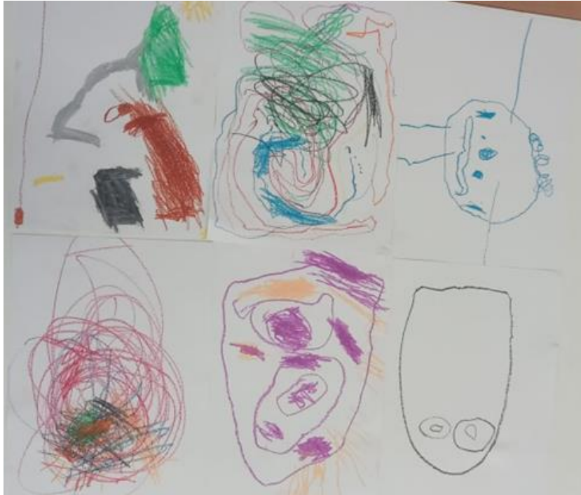
Figura 9. Dibuixos dels infants sobre la por