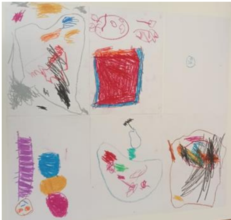
Figura 10. Dibuixos dels infants sobre la ràbia