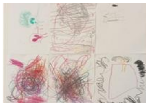
Figura 3. Dibuixos dels infants sobre la por.

Les idees expressades verbalment han estat representades en els dibuixos. Aquests són molt expressius, dels quals destaquen els colors foscos com el negre, el gris o el marró. El traç ha estat enèrgic i la majoria d'infants han volgut ocupar tot l'espai en el paper. Com a aspecte a ressaltar, en molts dibuixos apareix una explosió de gargots de colors els quals estan pintats de color negre per sobre.