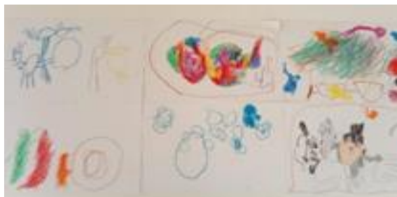
Figura 1. Dibuixos dels infants sobre l'alegria.

Aquestes idees han estat plasmades en els dibuixos realitzats posteriorment, on es pot veure que la majoria de dibuixos apareixen persones de la família o amics. En ambdues classes, els infants han fet ús de colors molt vius, amb predominança del color verd, vermell, groc i blau i el traç utilitzat ha estat molt expressiu i segur.