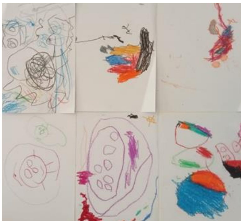
Figura 7. Dibuixos dels infants sobre l'alegria