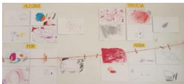
Figura 5. Mural de les emocions

El procés d'elaborar el mural s'ha dut a terme mitjançant la metodologia de l'escola la qual s'ha implementat Descobrim emocions amb la música . Aquesta treballa des del mètode global de l'aprenentatge de la lectura i escriptura, és per aquest motiu que en el moment de