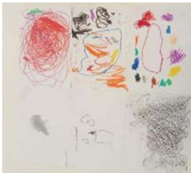
Figura 8. Dibuixos dels infants sobre la tristesa