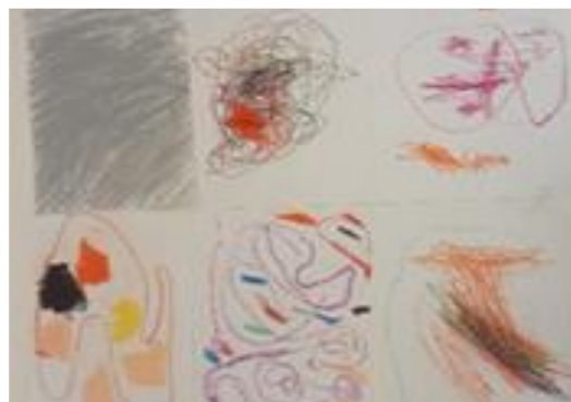
Figura 2. Dibuixos dels infants sobre la tristesa.

Els dibuixos que han representat els infants, en aquest cas, són expressius amb colors vius, com el rosa o el vermell, però hi ha presència de colors foscos: gris, negre i marró, colors que de manera general no solen utilitzar. Cal destacar, que en aquesta ocasió han dibuixat formes abstractes i gargots, no apareixen persones.