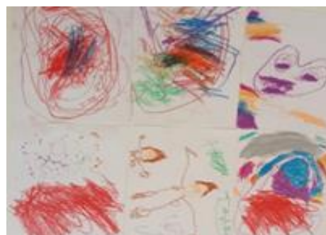
Figura 4. Dibuixos dels infants sobre la ràbia.

Pel que fa als dibuixos, en aquests ressalta el color vermell, fet que suggereix que els infants relacionen aquest color amb l'emoció. El traç es pot veure enèrgic i, de nou, gran part de la mostra d'estudi ha volgut ocupar tot l'espai en el paper. Cal destacar que molts alumnes han dibuixat cares enfadades.