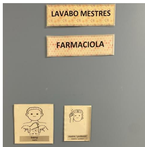
Imatge 1: De realització pròpia a l'Escola Guillem Fortuny.

Els responsables de portar a terme aquesta activitat seran l'equip docent i en col·laboració amb l'alumnat del centre educatiu, que comptaran amb tot el material necessari per fer els cartells. Els indicadors que ens marcaran el procés de l'activitat seran el nombre de cartells que es penguin pel centre escolar, i els indicadors que ens marcaran el resultat seran el nombre d'espais que l'alumnat sigui capaç de signar.