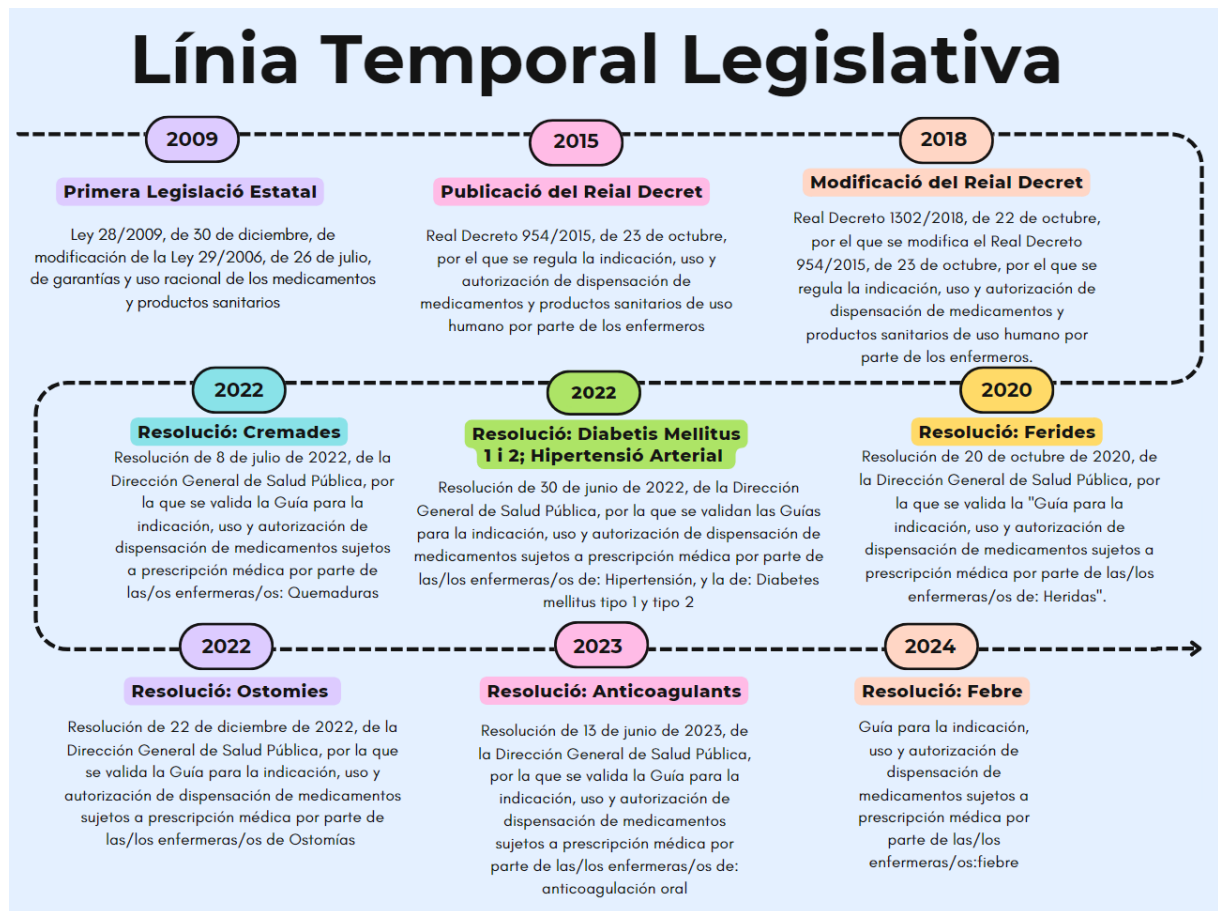
Figura 1: Línia temporal legislativa Espanya. Elaboració pròpia (2,7,14–19)

Al llarg dels anys han sorgit noves resolucions i decrets llei, els quals impliquen l'ampliació de dispensació de nous fàrmacs específics de certes patologies (13–17).