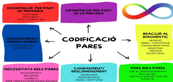
Il·lustració 1. Mapa de codis. Entrevistes a familiars d'infants amb TEA