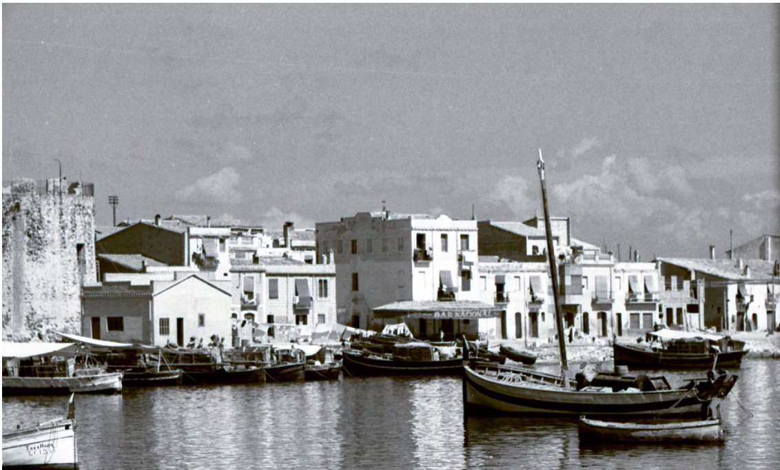
Port de Cambrils. (1946). N° 1499-18-095