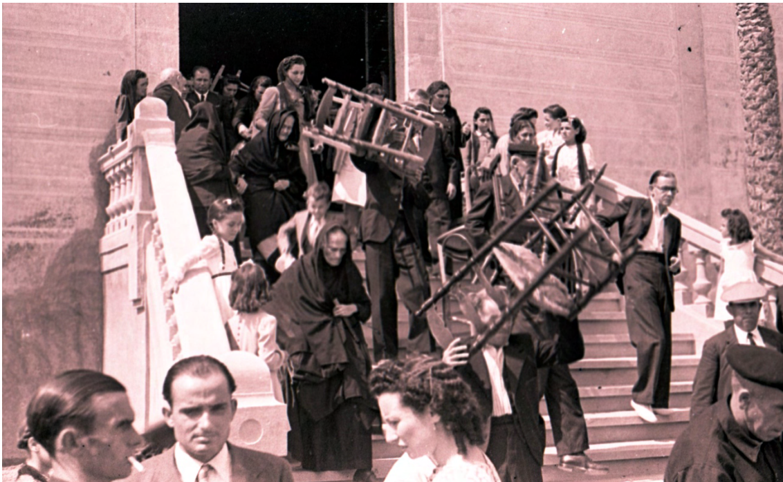
Celebració de Puríssima (1942). N° 14999-14-038

Ens situem a la plaça de la vila novament, just davant de l'antic ajuntament on trobem una gran congregació de gent en el que esdevé una celebració religiosa. Les figures més properes a l'altar són homes, amb un codi de vestimenta formal i que porten un ciri encès a les mans. Els homes estan agenollats en una posició de respecte, dirigint la mirada des de qualsevol punt de vista cap a l'altar del centre. Com podem veure en l'estructuració hi ha una divisió de persones diferenciades per la vestimenta i edat, això fa referència a l'estatus social i polític. Hi ha una jerarquització que respon a una voluntat de reconeixement social, aquelles persones que ocuparen càrrecs de poder, sigui polítics, autoritats locals, o militars estaven al front de l'escena, tot just davant de la població civil. A la part frontal de l'escena hi trobem aquells homes d'una edat més avançada i al darrere aquells més joves. Per altra banda, també destaquen les dones, sobretot les nenes que porten uns vestits blancs i llargs. Es tractava de tot un acte ritual on es feia una processó des de l'església fins a la plaça de la vila, on també podem veure a través de les imatges com els balcons i els porxos de les cases es decoraven amb banderes o símbols nacionals, ja que les imatges són de la celebració de l'any 1942.