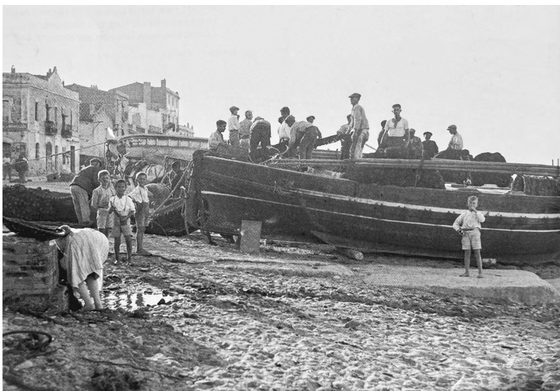
Barca varada a la platja. 1940. Nº 1499-21-33