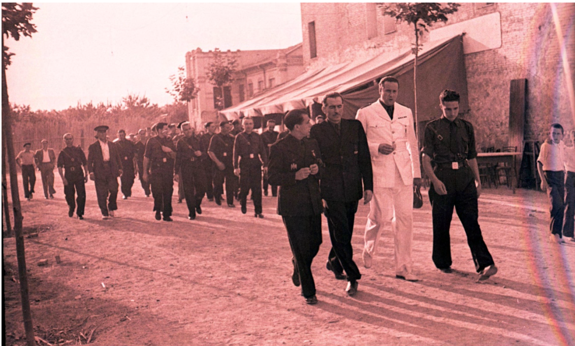
Desfilada Falangista de 1942. N° 1499-08-020

pescadors 20 . Tot i aquestes millores durant els primers deu anys del règim no trobem un volum considerable de visitants a Cambrils, encara no s'ha convertit en la destinació turística que és avui en dia. Ens trobem en una fase de transició entre aquest poble de tradicions pesqueres i agrícoles amb una vila reduïda al pas de convertir-se en una destinació turística. No va ser fins als anys cinquanta que aquest canvi demogràfic va començar a ser positiu a causa de l'avanç econòmic del poble, però en realitat no és a efectes pràctics molt notable fins a mitjans de la dècada dels seixanta on Cambrils rep un gran nombre de persones migrants del sud del país.