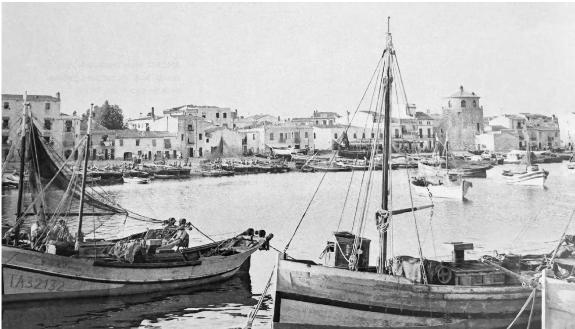
Vista del sorral fins a la Torre del Port amb barques varades a la platja i d'altres a l'aigua (1952). N° 1499-18-085