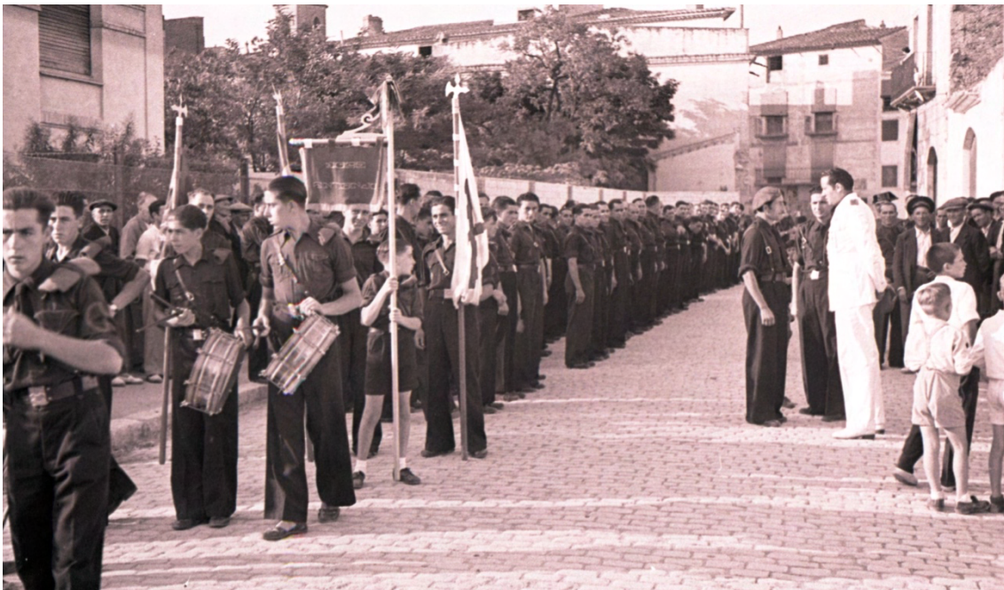
Desfilada Falangista de 1942. N° 1499-08-003.

Com podem veure a través de les imatges, els personatges més importants van diferenciats d'aquells que ocupen un rang inferior mitjançant un codi de vestimenta. Tot i això, presenten, tant els homes com les dones, una cautelosa uniformitat. Aquesta sensació que transmeten les imatges era intencionada, les marxes mostraven rostres serens, un moviment limitat i igualitari que pretenia exhibir valors com l'ordre. Aquestes organitzacions afiliades al règim tenien una estructura clara i estratificada, ja que l'important eren els camarades que conformaven el grup i eren presidits per altres membres d'una jerarquia superior que s'encarregaven de l'objectiu i l'enfocament d'aquestes.