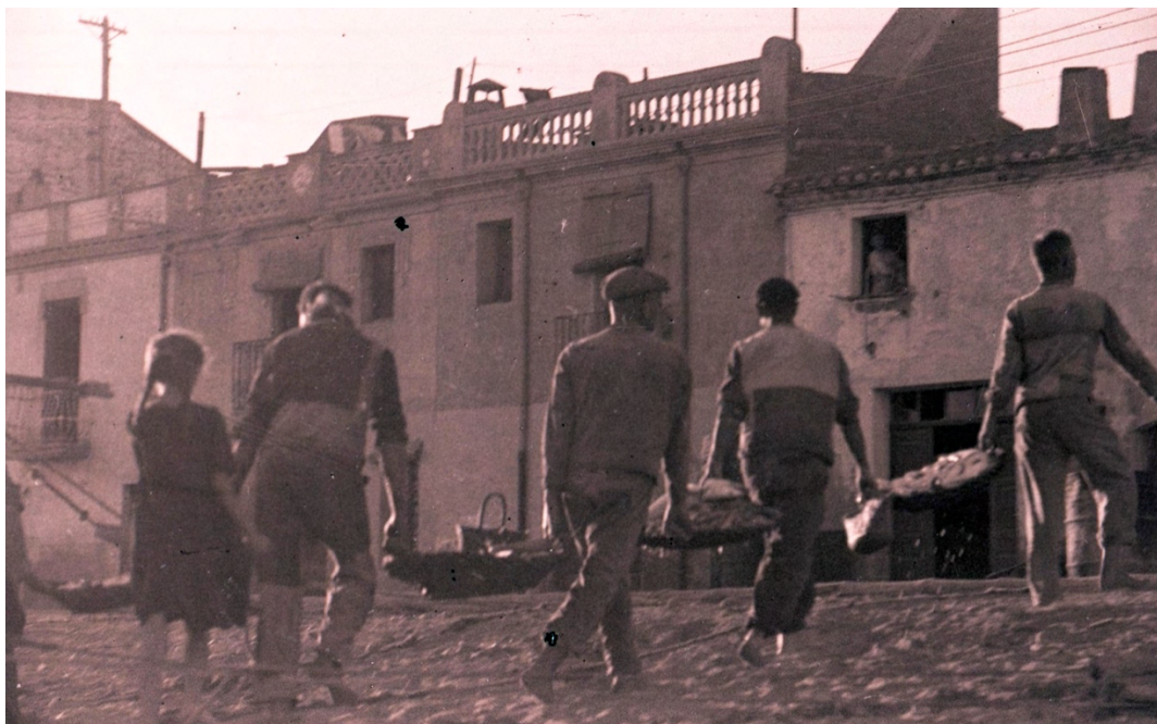
Pescadors. (1986). Nº 1499-21-033