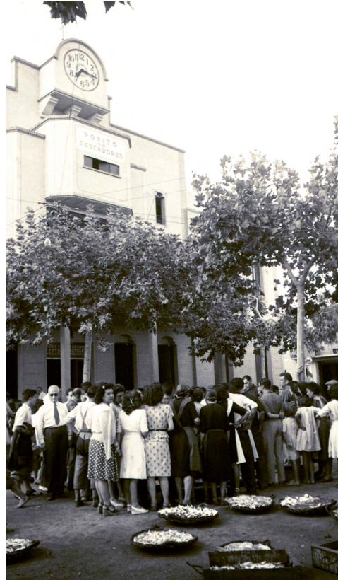
Subhasta Peix (1951). Nº 1499-30-017