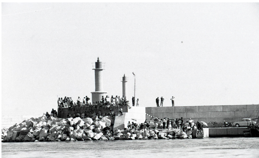
Pescadors al Campionat d'Esquí nàutic. (1962). N° 14999-28-B-004

esportiu que va més enllà i ´s el reflex d'una societat en ple canvi. Tot i que per al treball només he seleccionat unes quantes, el repertori és força més ampli. Comptant així amb fotografies de diferents modalitats com proves de salts o d'eslàlom. I en algunes imatges és força interessant veure el control de la competició amb les barques tradicionals dels pesquers de Cambrils que encara estaven a primera línia de Mar tot i que ja no estaven varades a la platja sinó que estaven separades per espigons de pedres. També destacar, que tot i que les fotografies estan datades del 1962, la competició es va celebrar durant dos mesos en diferents convocatòries. En desconexim si les fotografies eren del mateix dia, probablement es tractaven de dies diferenciats, però trobem una homogeneïtat en aspectes detallats com el cel que ens fan difícil fer-hi una aproximació específica.