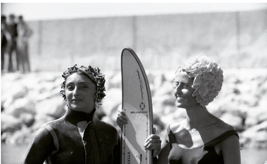
AMCAM. Fons Antoni Campañà. Esportistes Femenines al Campionat d'Esquí nàutic. (1962). N° 14999-28-A-010