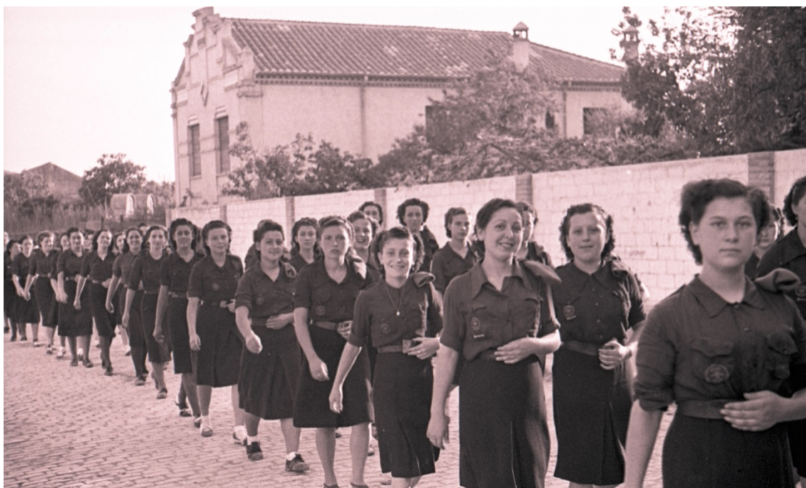
Secció Femenina Milícies en un acte d'Afirmació Nacional Sindicalista y de propaganda de la FET i la JONS. 1942. Nº 1499-08-014.

de la República va passar a ser plaça Espanya, el Carrer Francesc Layret a carrer del Generalísimo Franco, entre d'altres.