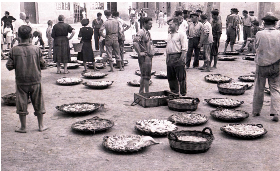
Subhasta Peix (1951). Nº 1499-30-014

La societat pesquera era molt important, com he mencionat anteriorment, era un dels eixos principals de l'economia i la societat. A través d'aquest ofici es poden explicar i entendre moltes de les relacions culturals i de l'evolució tant de la cultura com de l'estructura del poble. Fins i tot avui en dia, encara és un tret característic de caure tradicional i des d'altres indrets, Cambrils és conegut com una destinació clau dins de la pesca i la venda de qualitat de peix.