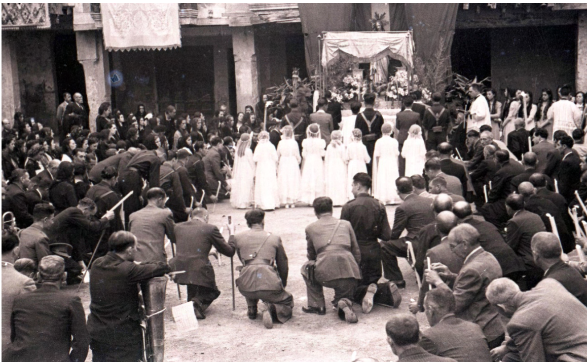
Celebració de Puríssima (1942). Nº 14999-13-004

Les fotografies de festivitats religioses mostren les pràctiques i rituals associats amb la religió en una determinada regió o comunitat. Això inclou vestimenta, processons, rituals cerimonials i altres aspectes culturals que poden haver evolucionat o canviat amb el