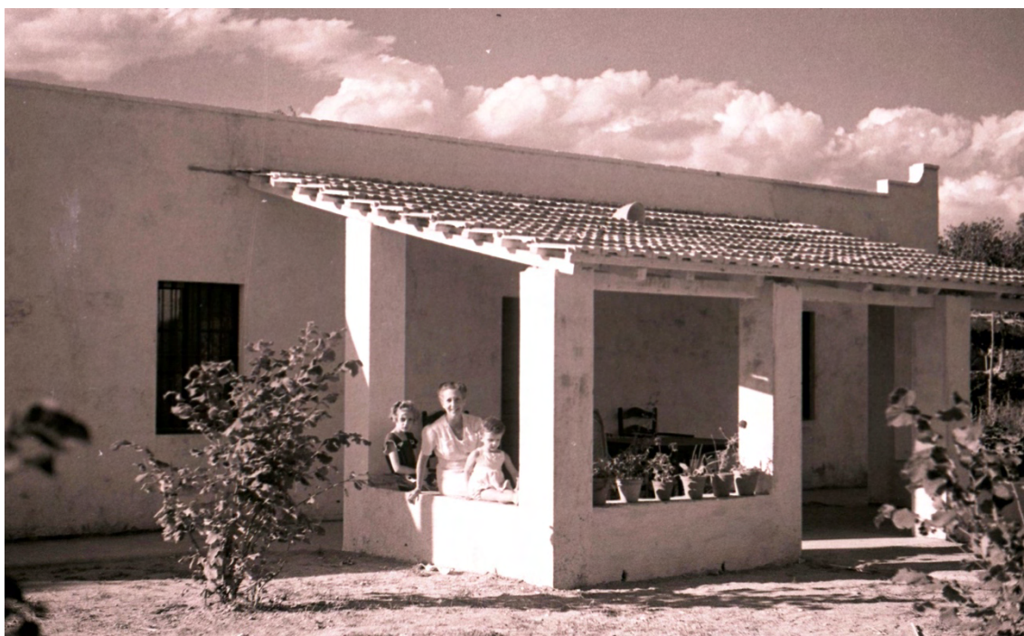
Casa Dolsa 1945. N° 1499-16-023