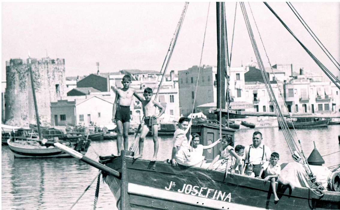
Port de Cambrils. (1946). Nº 1499-18-095

Retornant als orígens, la construcció del port va significar una nova etapa determinant per al desenvolupament socioeconòmic de tot el barri. Els vaixells i els pescadors es veien afectats a causa d'adversitats meteorològiques que causaven danys materials i de producte, cosa que es va poder resoldre amb la construcció d'aquest port-refugi. Amb l'arribada del ferrocarril la indústria a la pesca encara va créixer més i això de certa manera va obligar que es construís un port. Els avenços en la comunicació i el transport es van fer evidents i van impulsar l'economia dels sectors pesquers i agrícola de Cambrils. Ens hem d'imaginar que fins aquell moment el barri encara no estava constituït, segle XVII 30 , i els pescadors venien el seu producte en tendes molt petites ubicades a la zona de la torre o del Pòsit, sense comptar amb grans magatzems per guardar el peix. La carrega i descarrega, les dones que teixien les xarxes, les reparacions de les embarcacions, tot es feia a la platja, a la vora de les cases i d'aquest barri marítim.