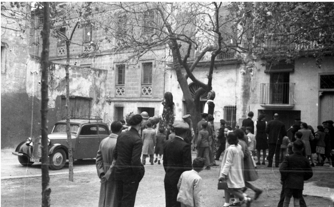
Festa/Gegants (1940). Nº 1499-15-001