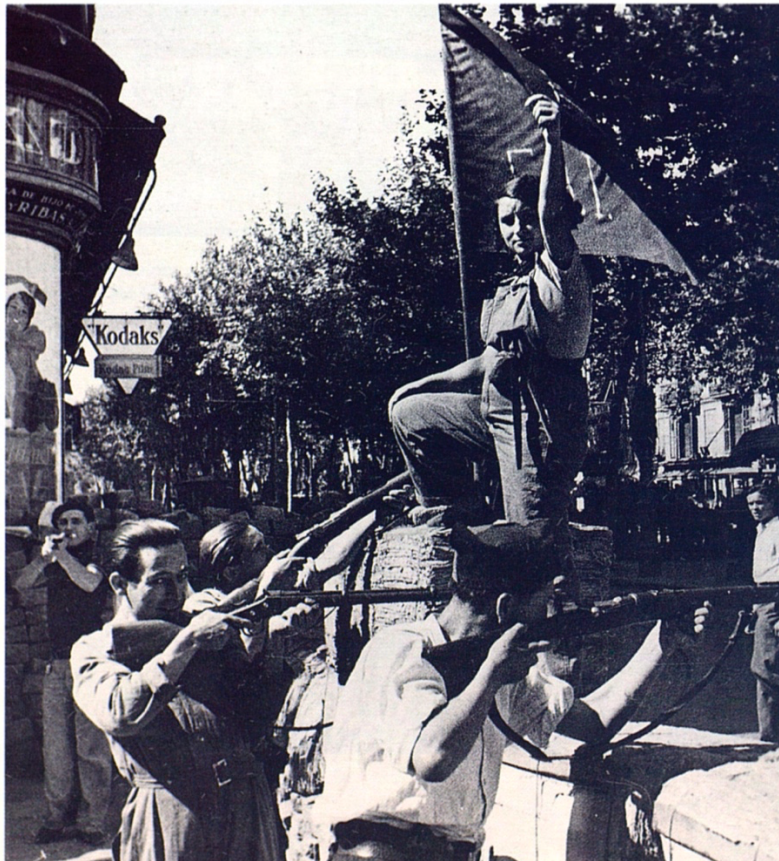
Barricada de la CNT a Rambla de Barcelona al costat de l'Hospital. 19 de juliol de 1936.

hi molts d'altres com Josep Brangulí 13 que va cedir les seves imatges de la Guerra tot i les conseqüències que podrien comportar. El conjunt de material compren des de l'inici de la Guerra fins a l'any 1939 quan també documenta l'entrada franquista dins de la ciutat comtal de Barcelona. Cal destacar que va ser l'únic fotògraf d'àmbit nacional que tenia permís gràcies a l'empresa que va muntar a Barcelona per a revelar fotografies amb compostos químics.