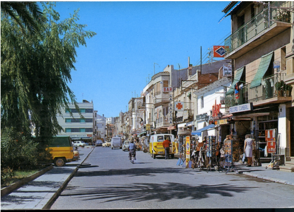
Postals Carrer del Consolat. (1960-1971). N° 14999-48-034