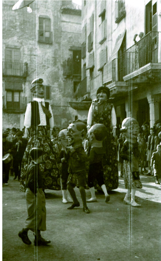
Festa/Gegants (1940). N° 1499-15-004