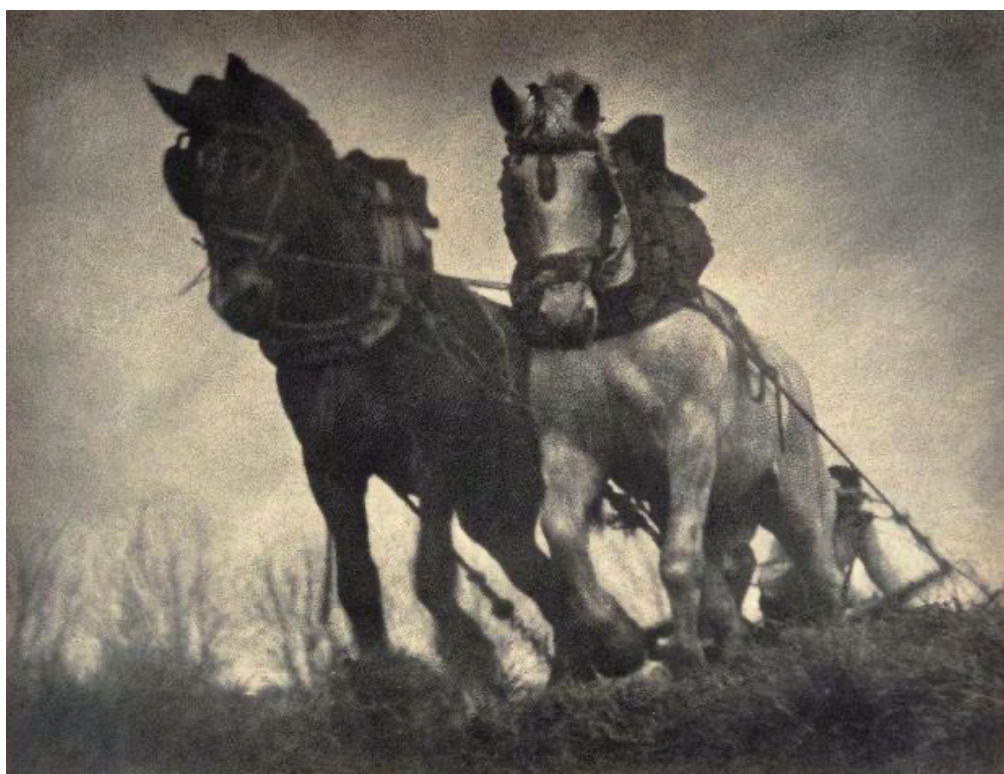
A. Campañà i Bandranas. (1933). Tracció de Sang . [Còpia Làmina]. Extret de i Tor, J. C. (1989). Orientaciones fotográficas . Antoni Campañà i Bandranas.

Just després de la Guerra Civil, el fotògraf va ser reconegut com un dels millors artistes del món dins de la seva disciplina per revistes com American Photograpy 15 . Segons els estudis de la seva carrera, es va presentar a més de cent salons diferents i compta amb gairebé tres-centes fotografies presentades a concursos de caràcter nacional i internacional. En aquest prestigiós anuari " The American Annual of Photography " publicat a Boston l'any 1939, Campañà va ser l'únic fotògraf d'àmbit nacional que hi figurava dins de la llista i això ens mostra la quantitat i alhora la qualitat de la seva obra. No només va ser un artista amb una gran producció al seu darrere sinó que els resultats obtinguts envers els reconeixements del seu art, que van ser d'un èxit rotund.