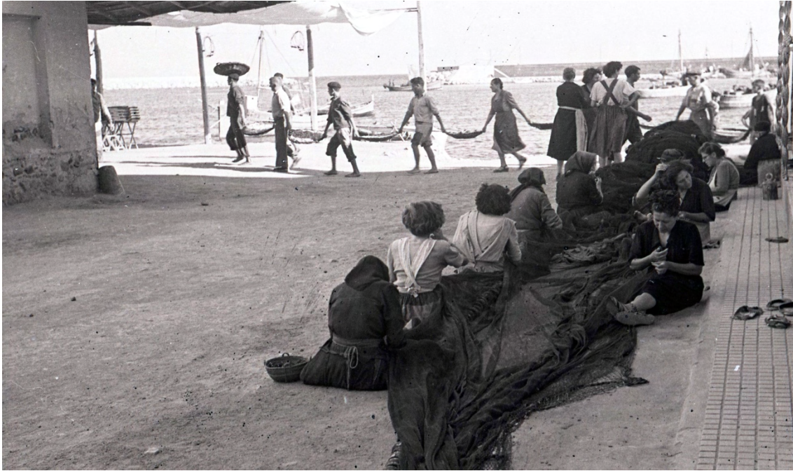
Dones teixint. (1950).