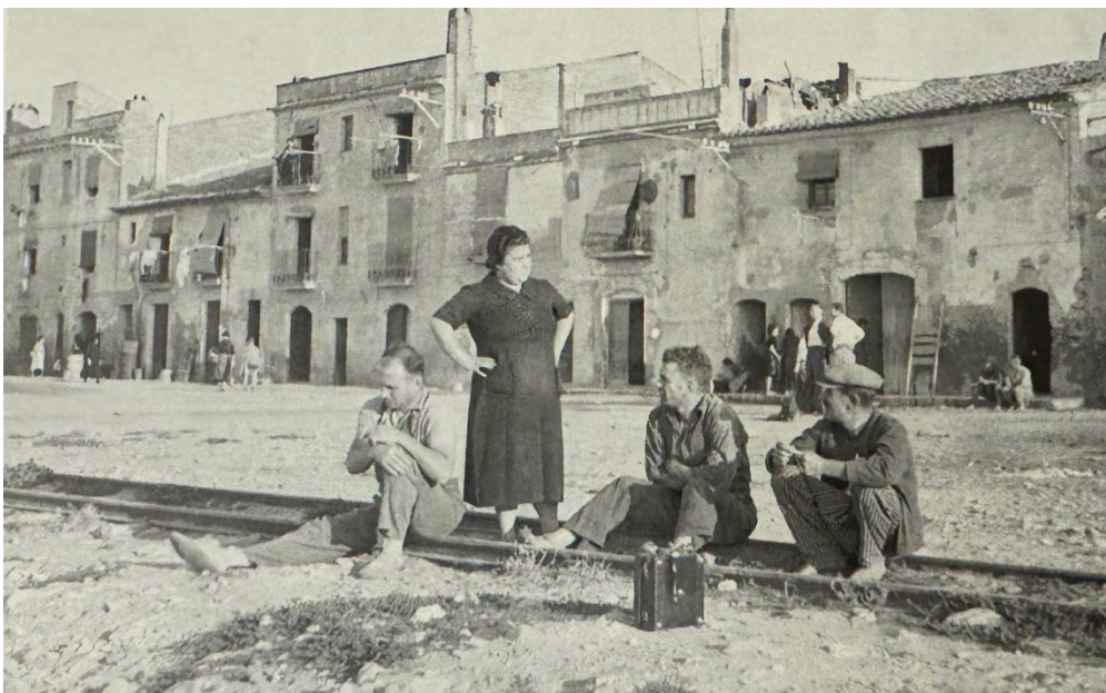
Construcció del port. (1939). N° 1499-18-096

millor significativa que tindria un impacte urbanístic i social. “A Cambrils, on s’ha de construir un port de refugi, el mar arribarà fins a les cases del barri marítim...” 31 . Finalment, després de diversos processos iniciats l’any 22, el 22 de desembre de 1932 se celebrà un acte públic amb motiu de la mostra dels inicis d’aquesta construcció de la qual se’n va fer ressò als municipis propers i a la que hi varen assistir diferents autoritats locals com els alcaldes de Tarragona o Reus d’aquell moment 32 .