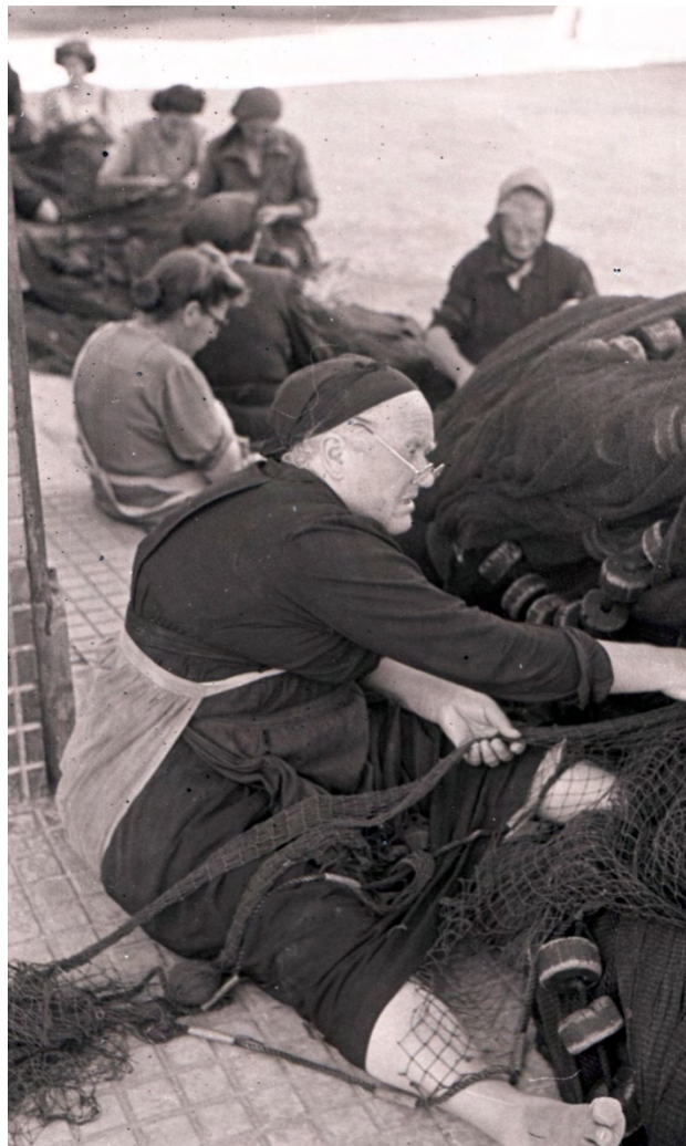
Dones teixint. (1950). N° 1499-24-032