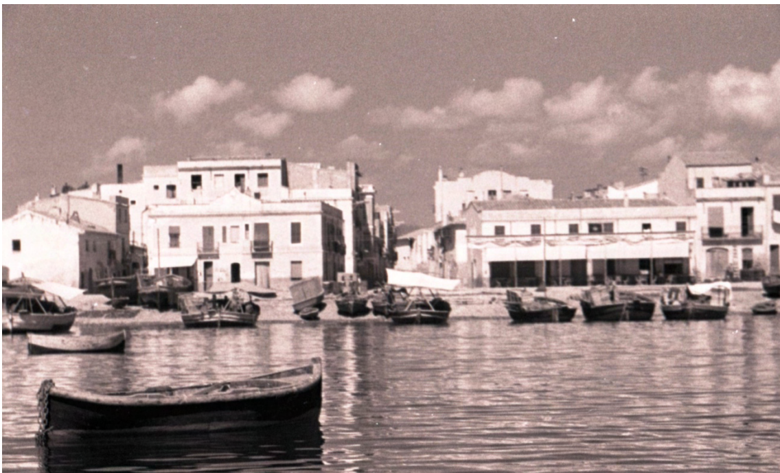
Port de Cambrils. (1946).

Sense el material que ens proporciona el fons de Campañà és molt difícil imaginar-nos la zona del port. Els canvis que va proporcionar la seva construcció van transcendir més enllà d'una mera construcció si no que també van afectar en altres àmbits marcant grans avenços envers els materials i mètodes de pesca. Tot això va incidir en la societat pesquera, ja que es varen crear noves necessitats i això va implicar una introducció de nous llocs de treball i rols que es desconeixien fins aleshores. Es canvien les maneres de treballar, l'estructura de l'espai urbà i geogràfic, fet que modifica els rols socials i les relacions laborals 29 .