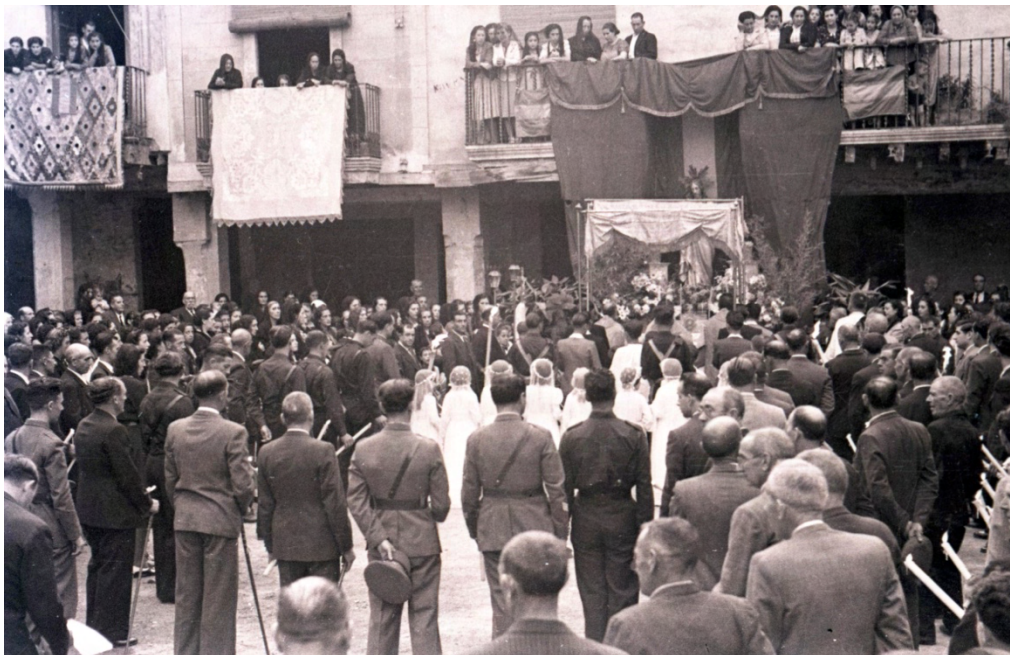
Celebració de Puríssima (1942). N° 14999-13-001