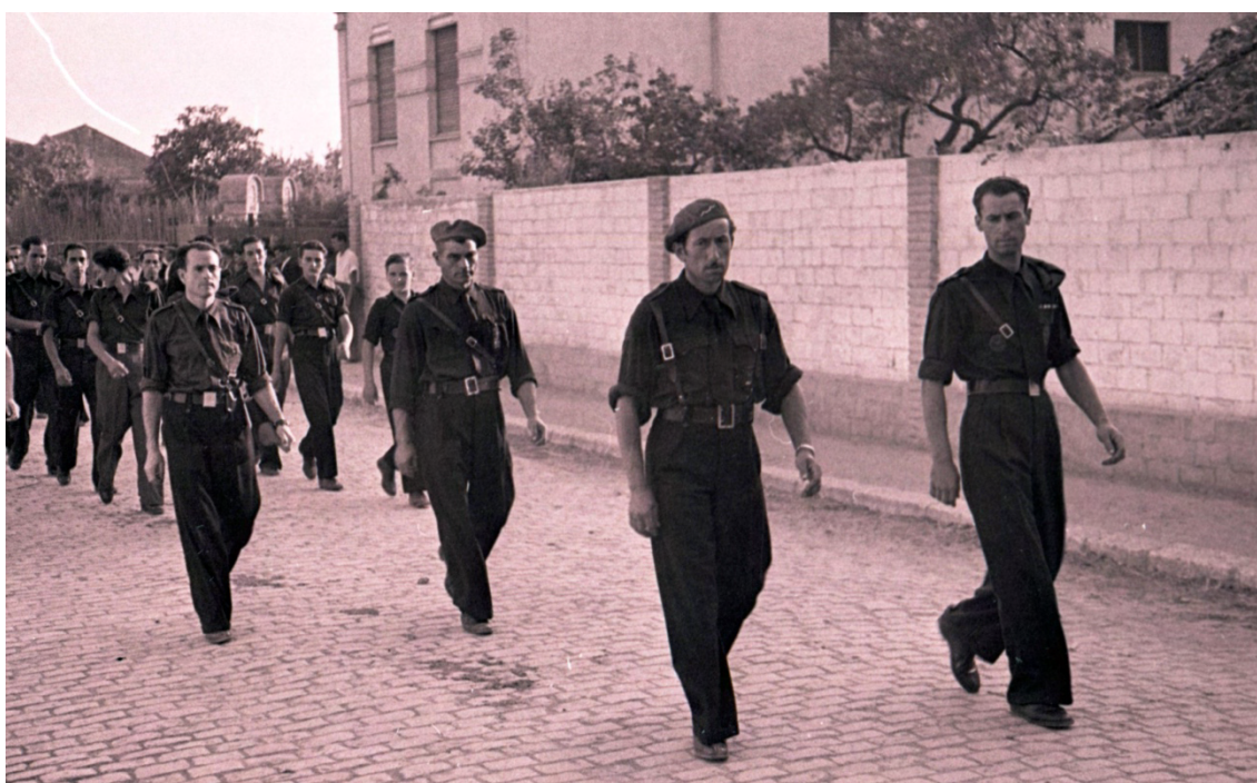
Desfilada Falangista de 1942. N° 1499-08-007.

Com podem observar les dones conformen un gran grup que desfila pels carrers del municipi amb una vestimenta uniformada de colors foscos. Totes elles comparteixen algunes característiques comunes com el rang d'edat que oscil·la ser el mateix en totes, amb pentinats curts o els cabells recollits amb un rostre net i clar. Per altra banda, podem veure com comparteixen una postura específica, el braç esquerre tocant l'estómac mentre que el dret el situaven paral·lel al cos. Aquest és un exemple de la participació de les dones en l'àmbit polític i social en un context històric complicat on es rebutjava la participació de la dona en política. Tot i això, aquestes dones van ser molt presents sobretot durant els primers anys del franquisme, varen servir per promulgar un model social que es volia instaurar sobre la dona franquista i catòlica 24 .