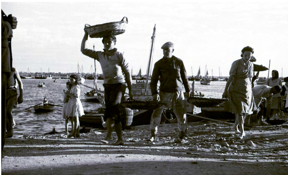
Subhasta peix. (1948). N° 1499-22055