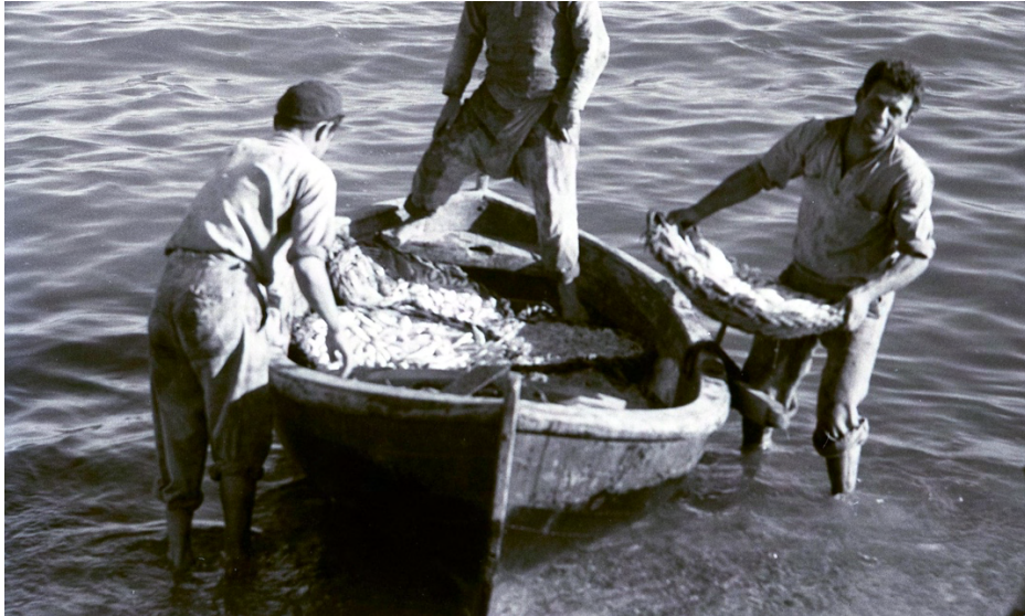
Subhasta peix. (1948). N° 1499-20-017

cobrar vida tots aquells relats dels quals em parlava la meva àvia, els records de com era Cambrils i dels canvis que havia patit, de les tradicions perdudes, però que encara eren vives sols en la memòria d'alguns.