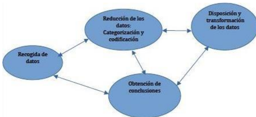
Ilustración 1: Modelo de análisis de Taylor y Bogdan.

Inicialmente, se lleva a cabo la recopilación de datos, en este caso las entrevistas semiestructuradas que hemos realizado virtualmente comentadas. Con el objetivo de organizarnos las entrevistas de manera eficiente creamos una tabla, véase en el Anexo 8. Una vez hechas, las transcribimos y nos las imprimimos cada una para leerlas por separado.