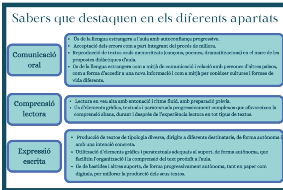
Il·lustració 4. Creació pròpia.