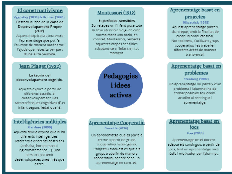
Il·lustració 2. Creació pròpia