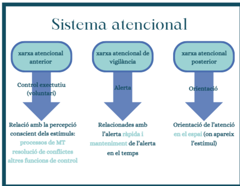
Il·lustració 1. Creació pròpia extreta de Casafont, R. (2017).

L'últim eix és el de l'atenció, el més important dels tres, segons asseguren les autores. L'atenció no pot donar-se sense les emocions. L'emoció és la que dirigeix l'atenció a allò que provoca més sentiments, en aquell moment concret. No obstant això, gràcies a l'escorça prefrontal podem redirigir l'atenció de manera conscient quan considerem la rellevància d'aquell que la capta, en centrar la nostra atenció, es reforcen els circuits neuronals implicats en la tasca atesa. A banda d'això, l'atenció té el seu propi sistema, el Sistema atencional.