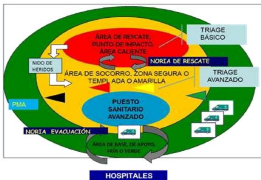
Figura 1. Cadena assistencial i zonificació de l'escena.