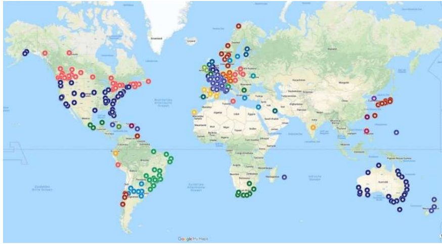
Ciutats amb manifestacions programades 22 i 23 de gener del 2022 13

Per la present anàlisi no s'ha pogut trobar informació consistent, sobre els orígens de la plataforma; a la seva web hi ha dos únics documents, un comunicat de premsa i un altre document que anomenen Platform , on exposen els objectius i fan la seva declaració d'intencions. No hi ha, però, informació de quines persones en formen part o quina és la seva estructura organitzativa.