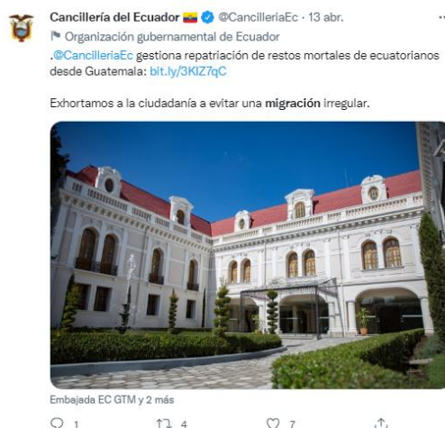
Figura 5: Contenido informativo sobre las acciones del Gobierno en la gestión que realiza en cuanto a un tema puntual de tragedia ocurrida por causa de la emigración irregular (51 tuits en contexto informativo).