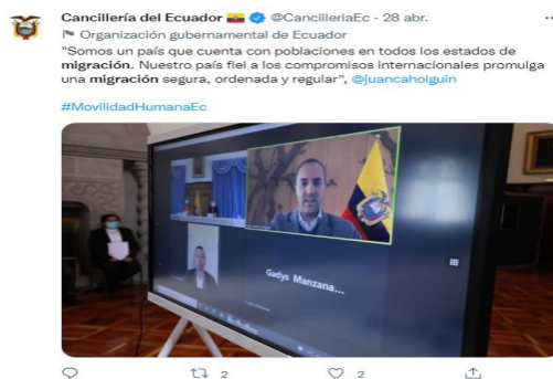
Figura 4: Contenido donde postean sobre el evento público donde participa la autoridad del Gobierno e indican sobre la gestión que realizan en torno a su participación en el evento público (41 tuits en contexto de eventos públicos de autoridades).

En la siguiente categoría sobre el proceso migratorio, la migración y el migrante, la matriz de datos nos indica que no hay información en la mayoría de publicaciones sobre esto, ya que la cancillería se encarga de comunicar lo que el Gobierno realiza más no de la situación de los compatriotas, ni la narración de sus experiencias. Salvo en contados casos, en donde, la situación tiene una fatalidad como la muerte de migrantes en los pasos por las fronteras o la repatriación de los cuerpos, el Gobierno toca estos temas, en la red social.