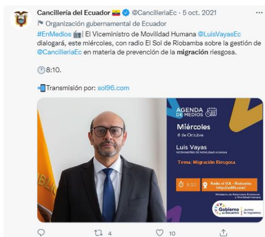
Figura 3: Contenido con lo cual invita a una entrevista en uno de los medios convencionales del país (10 tuits en el contexto de entrevistas e invitaciones a entrevistas de autoridades).

En cuanto a la categoría de tipos de migración, se puede ver que las publicaciones de la Cancillería están enfocadas en temas generales de migración, de hecho, se la cataloga como migración en general ya que no hay una profundidad en el tema, sino que se la trata a priori 8 , es decir, no hay un análisis ni reflexión sobre el tema tratado si no que, aparentemente, se trata de cumplir con una agenda determinada.