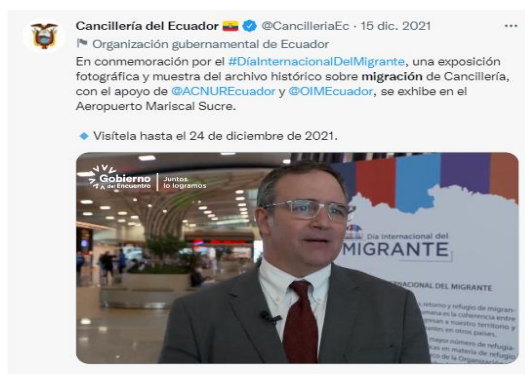
Figura 2: Contenido que no refiere directamente a los riegos de la migración irregular hacia los Estados Unidos (13 tuits en el contexto de campañas institucionales en redes sociales).

Fuente: https://twitter.com/i/status/1471224844368949251 (Twitter Cancillería Ecuador)