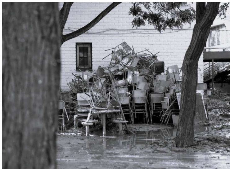
Imagen 1: Colegio afectado por la DANA, Redacción digital Noticias Cuatro, 2025

Cuando supimos la ratio de alumnos que podíamos acoger, desde ese momento los maestros que podíamos venir acudimos antes de la reapertura del centro para acondicionar las instalaciones y prepararnos para la nueva realidad. (Informante 8, 55 años)