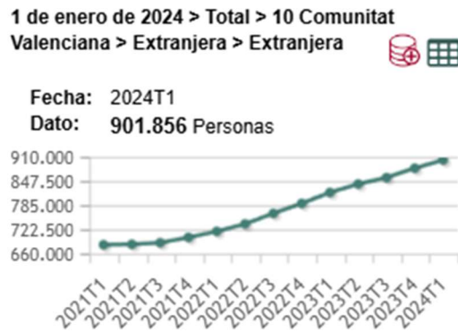
Gráfica 1: evolución reciente del aumento en la población extranjera residente en la Comunitat Valenciana.

En el contexto de las políticas migratorias vemos como actualmente los gobiernos europeos se encuentran obsoletos y desbordados, a lo largo de los años sistemáticamente se constata una brecha persistente entre política migratoria oficial y política migratoria real (Sánchez, 2011, p. 264) cómo pudimos comprobar con la llamada crisis de los refugiados de 2015 que puso de relieve las deficiencias de la política europea de inmigración y asilo (Fernández, 2021) ante la falta de recursos y servicios. Hasta no hace mucho, la proyección de estas políticas, la mayoría con fines económicos y utilitaristas, no se ha pronunciado demasiado en referencia a la protección de menores inmigrantes. Estas leyes de extranjería se han ido actualizando ante la demanda y el aumento de estos, haciendo responsables a las CC. AA de la acogida y el bienestar de los inmigrantes, pero esto, como ya sabemos, depende de las ideologías políticas de los diferentes gobiernos de cada comunidad. El 19 de marzo de 2025, ante el aumento de la llegada de menores inmigrantes no acompañados el BOE publica un Decreto Ley en el que se aprueban un paquete de medidas extraordinarias que establece que: