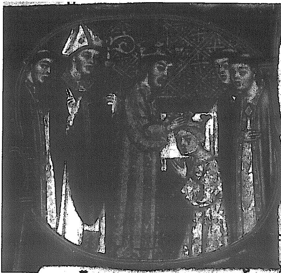
Ceremonial de la consagración y coronación de los reyes y reinas de Aragón , fol. 35v. 2ª mitad del siglo XIV. Fundación Lázaro Galdiano (Madrid). Reg. 14425

ceremonial, pues sus líneas dictaminan que, conforme el rey vaya tomando las respectivas insignias, el metropolitano rece las oportunas oraciones 103 . Semejante escena, con idéntico significado, se observará en una de las miniaturas que orna el precioso Pontifical Hispalense encargado el 10 de mayo de 1390 por Juan de Guzmán.