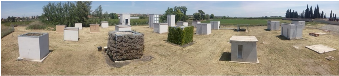
Figura 1. Instalación experimental.

En este trabajo la metodología se aplica al almacenamiento de energía térmica en edificios. Para ello, se usa la instalación experimental disponible en Puigverd de Lleida (España) donde existen diferentes cubículos que incluyen diferentes sistemas de construcción (de Gracia y col., 2010) (Figura 1). Se estudian cuatro cubículos, uno sin aislamiento, otro con aislamiento y dos más conteniendo materiales de cambio de fase (PCM, del inglés Phase Change Material) como tecnología TES. Los PCM usados son uno orgánico (parafina, PCM1) y otro inorgánico (sal hidratada, PCM2).