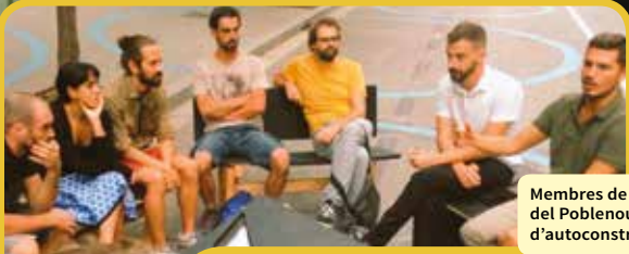
Membres de l'AJAC debaten a la superilla del Poblenou sobre els nous processos d'autoconstrucció.