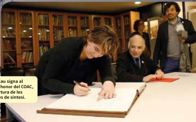
Ada Colau signa al llibre d'honor del COAC, a l'obertura de les jornades de síntesi.