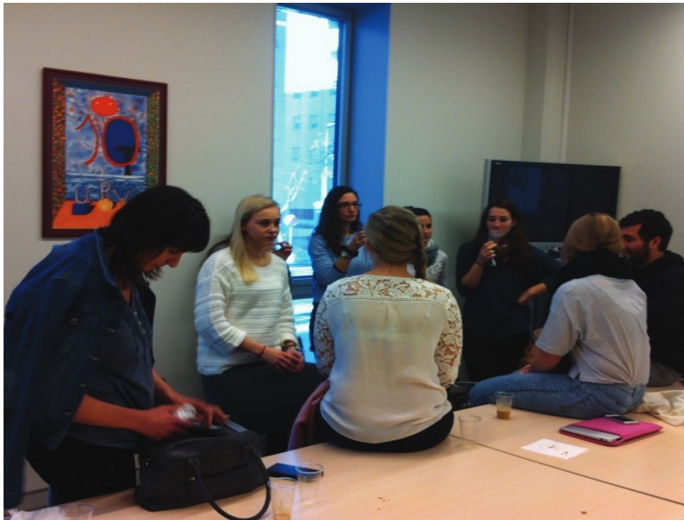
Jornada reflexiva amb la professora delegada del Programa ENM al campus Catalunya, amb 4 alumnes procedents de l'Ostfold University College (Norway) i els seus alumnes guia URV. Març de 2015.