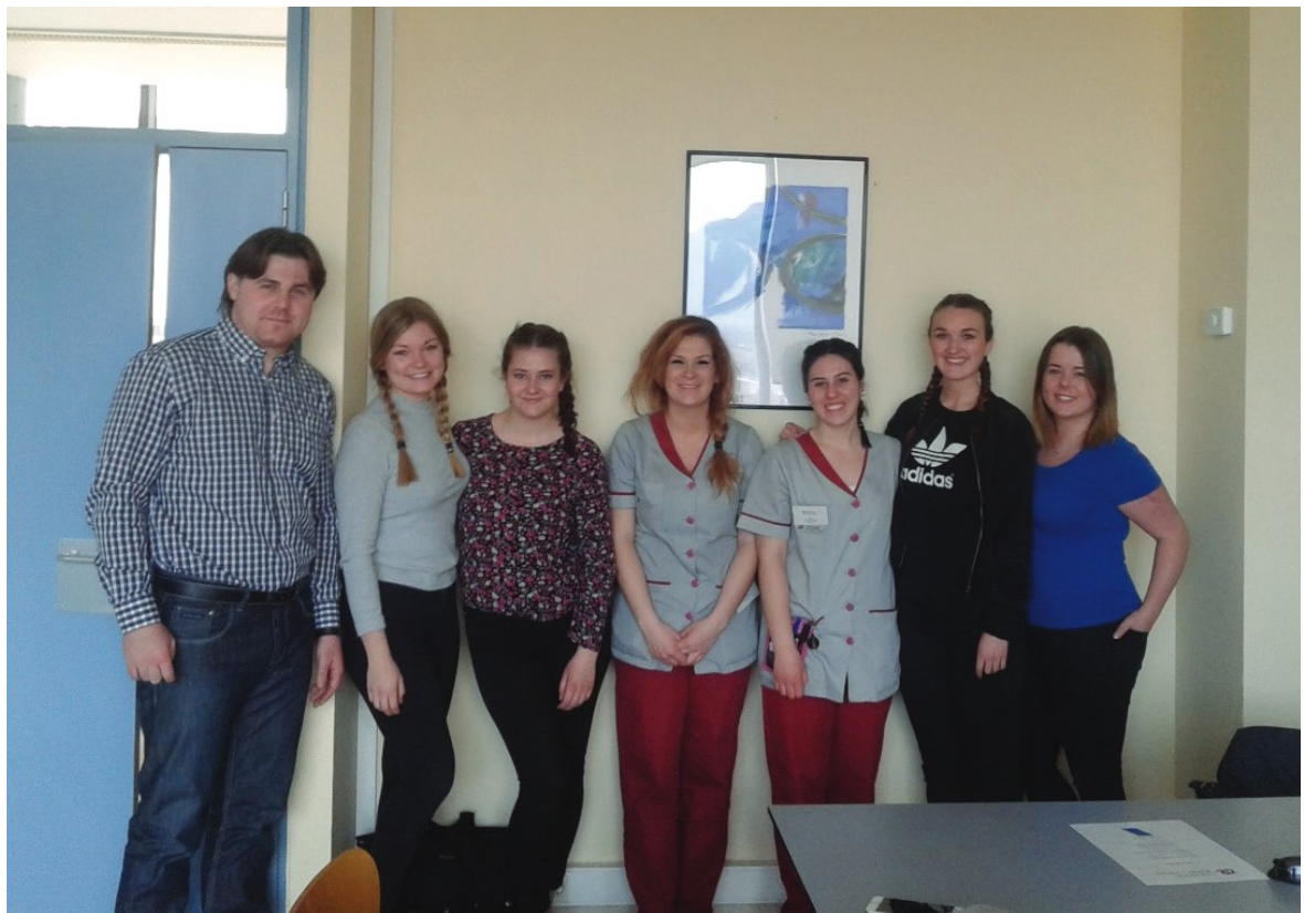
Jornada de reflexió a Tortosa amb estudiants procedents de Noruega i Suècia, març de 2016.