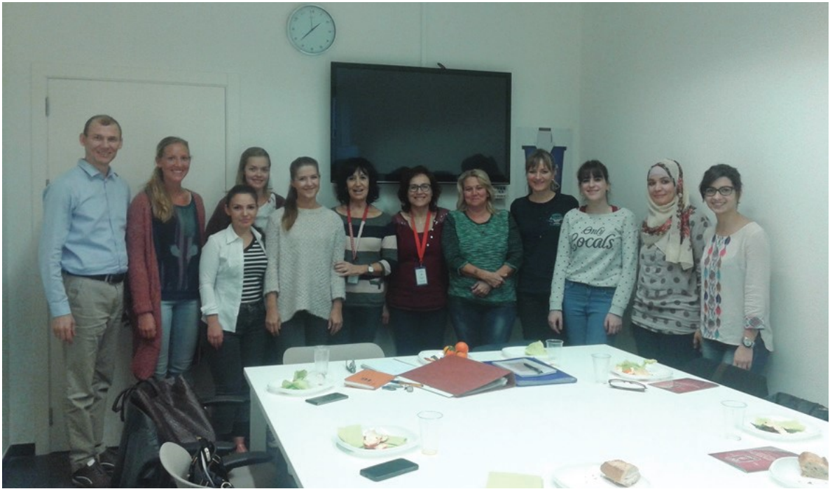
Jornada de reflexió al campus Terres de l'Ebre amb alumnes de Rumania, Macedònia i Noruega i els alumnes guia de la URV, octubre de 2015.