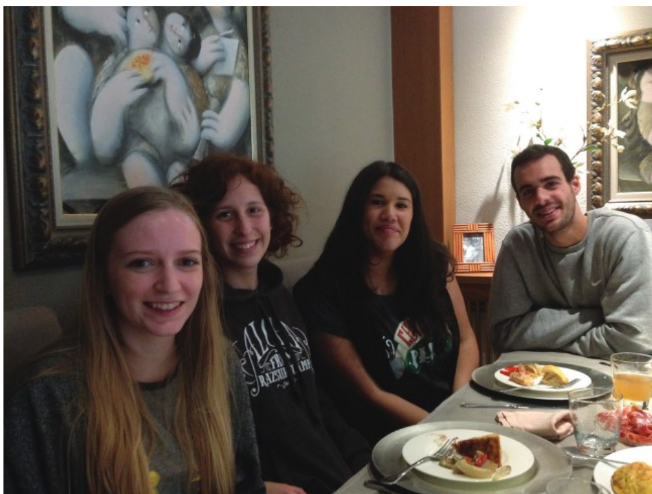
Dinar ENM amb productes típics de la comarca, amb tres estudiants procedents de Winterthur (Suïssa), una estudiant procedent d'Antwerp (Bèlgica), la professora delegada i els alumnes guia de la URV, al campus Catalunya, març de 2016.