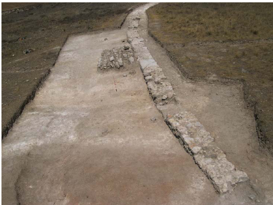
Figura 4. Vista general desde el sur de los carceres del circo de Segobriga y algunas de las ollas del ritual fundacional del edificio halladas en su excavación.