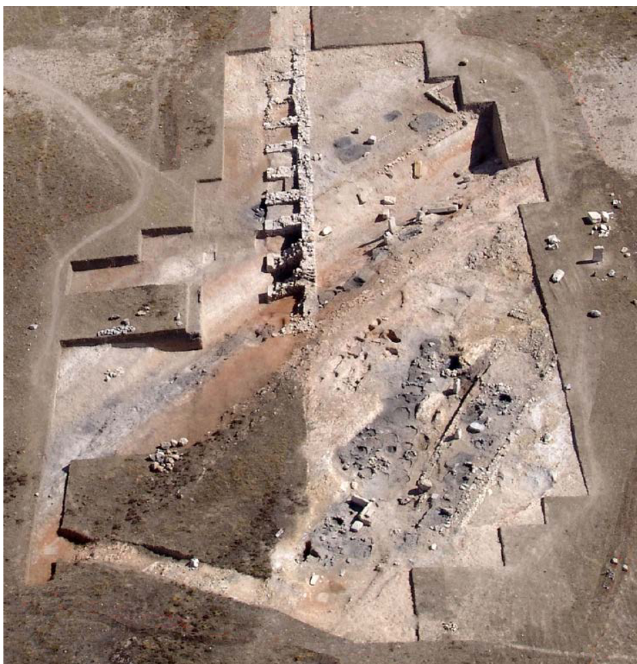
Figura 5. Superposición del graderío norte del circo sobre el sector de la necrópolis noroccidental excavado a lo largo de la vía funeraria colmatada para la nivelación de la arena.