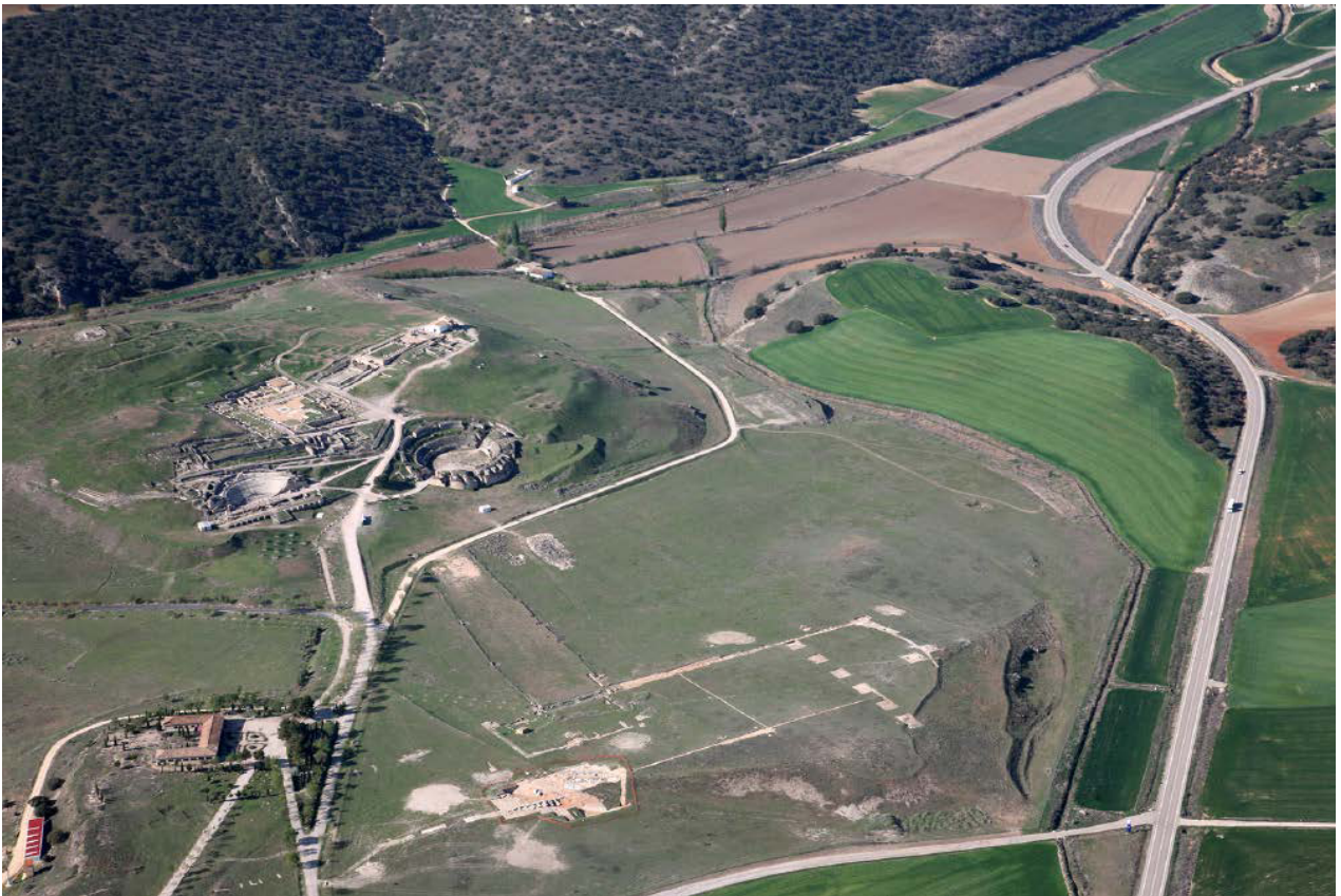
Figura 1. Vista aérea de Segobriga desde el norte. En primer término, el circo.