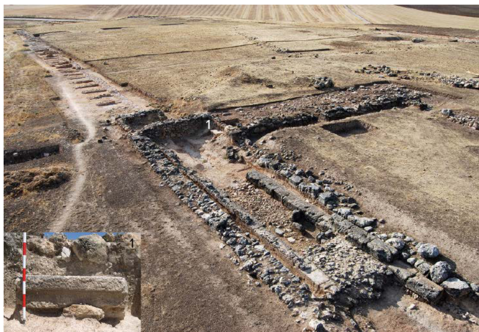
Figura 3. El sistema de celdas utilizado en la construcción del graderío sur del circo. En primer término, la tribuna sur, y con el n.º 1 se identifica el lugar donde se halló una pieza de asiento.

En total se debieron proyectar doce carceres distribuidos en dos grupos de seis en torno al eje axial del edificio, lo que corresponde al habitual número de tres carros para cada una de las cuatro factiones rivales. De su geometría se desprende la existencia de un espacio central de 12,60 m de ancho que su-