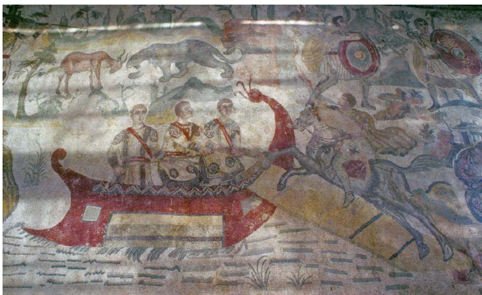
Figura 3. Representación de un jinete y su caballo embarcando, gracias la ayuda de tres hombres y mediante una rampa. Mosaico de la Gran Caza de la villa romana del Casale (fotografía: D. Osseman). Disponible en < http://www.pbase.com/dosseman_italy/armerina&page=all > [consulta 02/02/2017].

(FRIEDMAN 2011, 155). Uno de los barcos presenta una banda decorativa con tres tiras de puntillas característica de los navíos imperiales empleados para el transporte de animales africanos a Roma, cuyo destino eran los juegos realizados en el circo y en el anfiteatro (FRIEDMAN 2011, 154-157) (fig. 3). Del mismo modo se representa una nave más pequeña identificada como una embarcación propia de la flota imperial auxiliar, por lo tanto militar, cuyo cometido sería el de patrullar el resto de barcos.