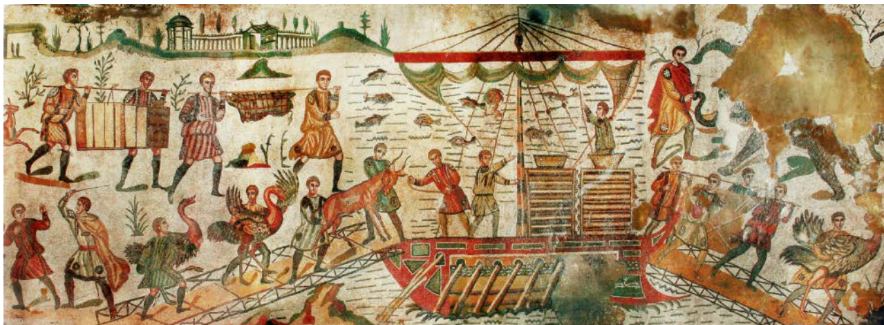
Figura 2. Escena central del mosaico de la Gran Caza de la villa romana del Casale. Se puede observar el embarco de animales salvajes, así como la disposición de unas cajas de madera para su transporte (Wikimedia Commons).

barcos pesqueros, fluviales y comerciales (GAUCKLER 1905).