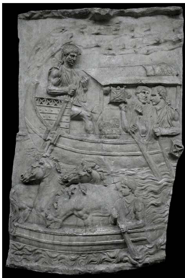
Figura 4. Detalle de la Columna Trajana en el que se observa el transporte de caballos mediante una barcaza de río.

En este sentido, otros ejemplos iconográficos de transporte de équidos se hallan en Carthago (Túnez), concretamente en el mosaico de la Caza de Dermech. En este mosaico del siglo VI dC. aparece un caballo embarcando en una nave comercial a través de una rampa y ayudado por unos personajes ataviados con túnica militar. Esta representación análoga a la de Piazza Armerina pone de relieve la implicación militar en los asuntos de caza y captura de animales. Asimismo no podemos dejar de mencionar uno de los relieves de la columna Trajana