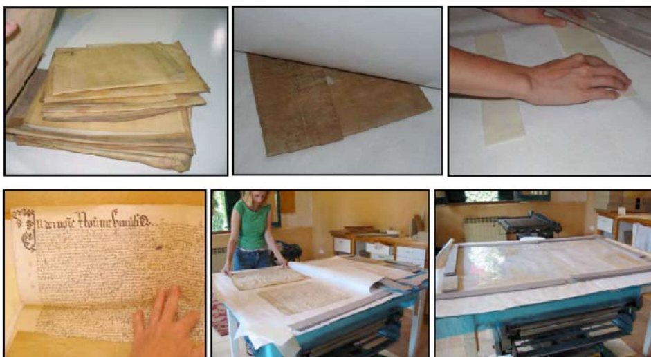
Estirament de pergamins.

regnes hispànics, des del segle XIII en endavant. La majoria dels còdexs són de caràcter històric, jurídic, genealògic o financer.