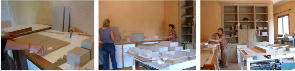
Construcció de les capsas.

el seu propi pes. A la part superior de la planxa de Gore-Tex humida posaven tires de paper secant, aplicant-ho a les vores plegades dels pergamins, permetent així concentrar la humitat de forma localitzada. D'aquesta manera els documents es podien anar obrint gradualment, amb seguretat i sense infligir danys. Un mètode que va resultar flexible i eficient, mitjançant el qual s'allisaren més de 600 pergamins.