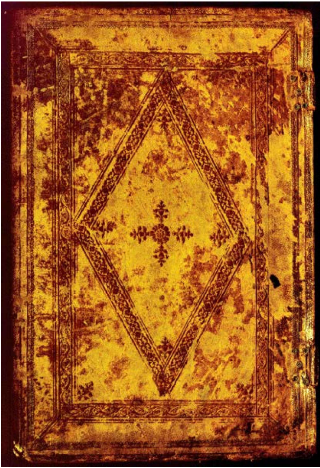
Tapa en cuir del manuscrit.

Pel que fa a la catalogació, l'equip de Vilassar va fer una valoració de la documentació en paper. Segons les estimacions d'aleshores, comptabilitzàvem –sempre aproximadament– uns 419 manuscrits, uns 140 volums impresos i a més uns 485 lligalls en què de manera informe apareixien pergamins, llibres i documentació solta. En relació als lligalls, vàrem comprovar que no tots ells responien a una mateixa procedència ni es referien a una