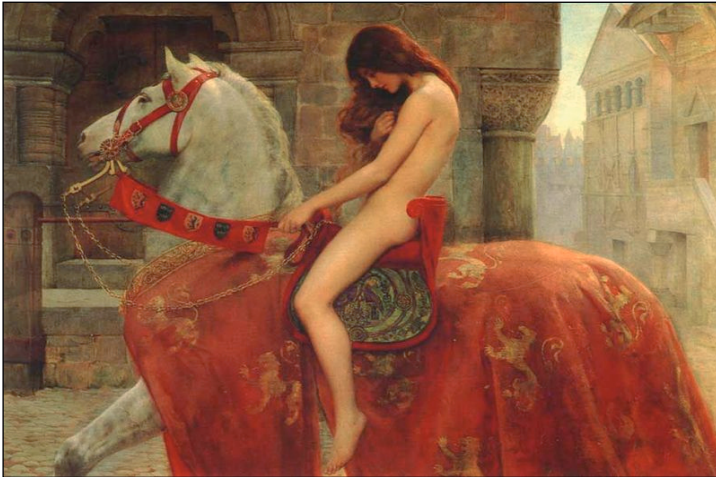
Lady Godiva, per John Collier, c. 1897 18

I tants d'altres que la saviesa de la gent ha anat conservant i repetint de generació en generació.