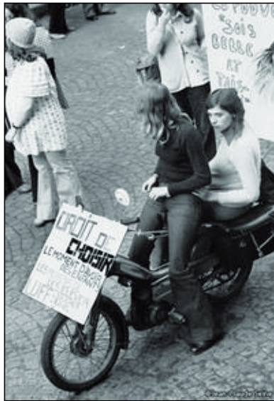
Eslògans feministes en una manifestació parisenca.

Francès. Del moviment estudiantil del 68, en va recollir les concepcions polítiques, la definició extensa de què és política, el radicalisme, la utopia i el messianisme, i a tot plegat li va donar continuïtat. «Tot és polític», es va dir durant el Maig del 68. És a dir, que la política no era un àmbit separat de la resta de la vida, ni la comesa exclusiva dels professionals de la política. Tot es podia posar en dubte: la política, les relacions socials...; però també la vida quotidiana, la cultura, la filosofia de la vida... L'objectiu era «canviar la vida». La democràcia només es concebia directa, immediata; se n'excloïa qualsevol idea de democràcia representativa. Aquesta concepció va ser també la del Moviment d'Alliberament de les Dones, que afirmava: «Allò que és personal també és polític.» Amb això volia dir que les relacions personals i privades 24 —domèstiques; però també afectives i sexuals— són, alhora, relacions socials. Són polítiques en la mesura que són col·lectives, fins i tot si es produeixen, ben sovint, en relacions interindividuais. En aquest sentit, no hi poden haver solucions individuals.