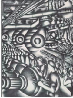
Jolan Gross-Bettelheim: Home Front , 1943

necessitat. 1918: les mestresses de la classe treballadora de Barcelona van convèncer les obreres tèxtils que fessin una vaga pels alts preus.