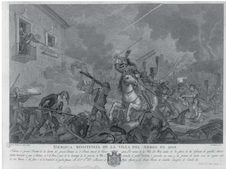
Arboç 1808. Diversos pobles catalans patiren destrosses durant la guerra del Francès: un dels casos més significatiu fou el de l'Arboç. (Gravat de l'entrada de les tropes franceses a l'Arboç, el 9 de juny de 1808. Biblioteca Nacional)

100.000. D'aquestes, aproximadament les dues terceres parts (unes 350.000 persones) van morir per causa directa o indirecta de la guerra. De fet, la guerra del Francès va resultar la més letal de les guerres de la història contemporània espanyola, supera fins i tot la Guerra Civil Espanyola en mortalitat relativa. I, tot plegat, sense tenir en consideració les víctimes de l'exèrcit napoleònic i dels aliats. Probablement, cap altre estat europeu va patir una sagnia equivalent durant l'època napoleònica.