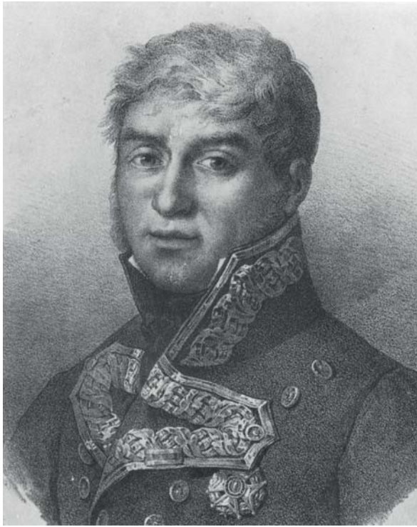
El general Luis de Lacy va encapçalar la revolta liberal de 1817 contra l'absolutisme i fou afusellat al castell de Bellver. (Gravat de la Biblioteca Nacional)

finalment, l'1 de gener de 1820 el del coronel Rafael del Riego a Andalusia que acabarà triomfant.