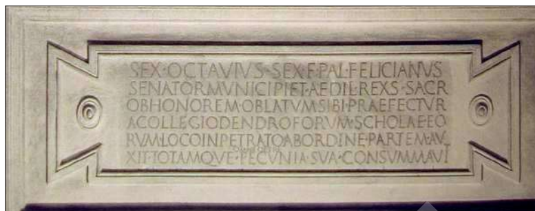
Figura 1: Placa de Sex. Octavius Felicianus . Villa Albani, Roma.

La paleografía responde al tipo usual de la capital cuadrada de entre finales del s. I y primera mitad del s. II d.C. 6 . Alt. letras: 4,5 (l. 6: 2) (Fig. 1).