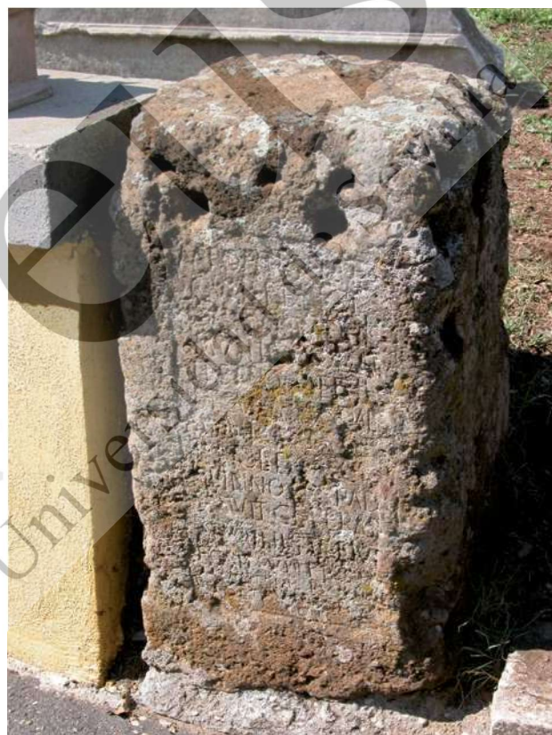
Figura 3: Pedestal de M. Pontius Felix . Villa Rufinella, Frascati (RM).

uno de los colegios sacerdotales de rango ecuestre fundados en época augustea para celebrar los sacra de las antiguas comunidades laicales en la ciudad de Roma 44 . M. Pontius Felix fue honrado con una estatua por colecta pública, gesto que el obsequiado gratificó ofreciendo un banquete popular, datado en el 131 d.C., precisamente bajo el consulado de Pontianus 45 . Cabe señalar que el pedestal en toba local que contiene la inscripción es de reducidas dimensiones (82 x 44 x 44 cm), capaz de alojar una estatua en bronce de tamaño menor del natural (Fig. 3). Tanto el tamaño como la serie de encajes conservados para un cimacio también bronceo lo asemejan visualmente a la serie de pequeños pedestales que conforman la galería de época republicana con los nombres de