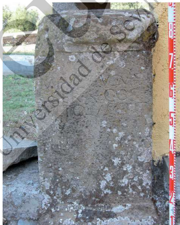
Figura 4: Pedestales de dos summi viri tusculanos: (izquierda) Telegonus, héroe fundador de la ciudad, y (derecha) M. Fulvius (Nobilior). Villa Rufinella, Frascati (RM).