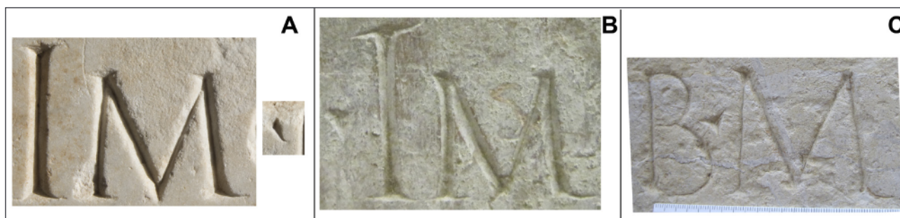
Figura 4. Comparativa paleográfica. a, nueva inscripción; b, CIL II²/14, 992; c, CIL II²/14, 1110.

aunque su interpretación es compleja. Una posibilidad sería pensar que se trata del cognomen de un segundo personaje homenajeado en la inscripción, aunque esta opción parece poco probable. A pesar de la distancia entre ambos, más consistente parecía considerar que los términos curator y primus podían funcionar juntos, a favor de lo cual se mostraba la lectura propuesta para una inscripción de Pagnan, atribuida a Narbona, que mencionaba este cargo en relación a un templo del Divus Augustus 32 . Sin embargo, tras contemplar la pieza narbonense comprobamos que está fragmentada por el lado izquierdo, por lo que en una restitución aproximada de su anchura podemos observar con claridad que entre primus y curator queda un espacio suficiente como para pensar en la existencia de una palabra no conservada que, en virtud del cursus del personaje homenajeado, sólo puede tratarse de un sacerdocio.