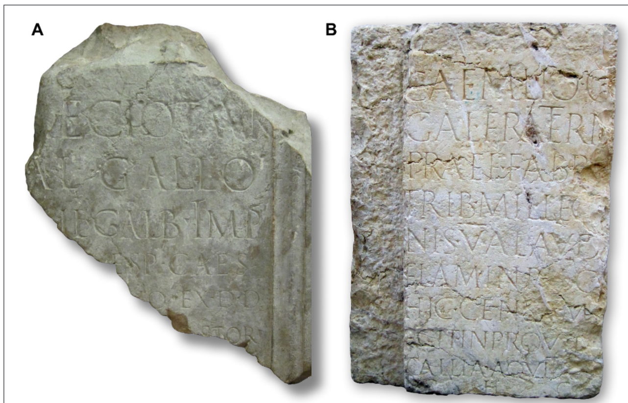
Figura 3. A, Pedestal de Raecius Gallus (CIL II 2 /14, 992); B, Pedestal de C. Aemilius Fraternus (CIL II 2 /14, 1110) (Fotos: D. Gorostidi, por cortesía del MNAT).

líneas de texto y 4 letras, G. Alföldy propone leer lo siguiente: --- · Divi · Vesp(asiani) / [f(ilius?) · --- · aed]em / ----- . En su opinión, se trata de una inscripción edilicia que menciona a los emperadores Tito o Domiciano como responsables de la construcción o restauración de una aedes . Puesto que la fórmula aedes divi Augusti no está documentada epigráficamente, pensamos que la aedes mencionada sólo podría ser otro de los edificios del recinto de culto, la denominada sala axial 26 , dedicada al Divus Vespasianus con o sin el Divus Titus 27 , mientras que el templum sería el dedicado al Divus Augustus .