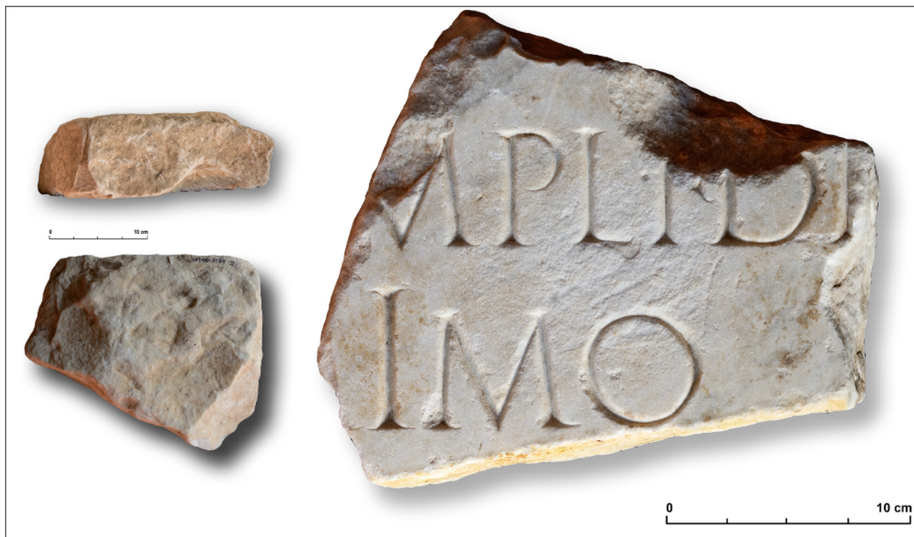
Figura 2. Inscripción: cara inscrita y parte posterior (Fotos: J. M. Macías).

monetarias 14 . En cambio, sí disponemos de estratigrafías y contextos cerámicos fechados en época flavia y relacionados con la sede monumental del Concilium Prouinciaie en este momento. Aunque las referencias estratigráficas más precisas se sitúan en el exterior del peribolos 15 .